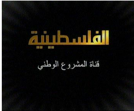
Logo de la chaîne satellite Al-Filastiniyya

9. Le 18 février, le comité révolutionnaire du Fatah a décidé de lancer une chaîne de télévision satellite dirigée par Nabil Amr . 2 Baptisée Al-Filastiniyya , la nouvelle chaîne a commencé ses émissions-test le 6 juin. La chaîne émet actuellement trois heures par jour, de 19h00 à 22h00. Selon Nabil Amr, le contrôleur général de la chaîne, Al-Filastiniyya est actuellement dans une phase de test. Les émissions-test, qui doivent débiter dans quelques semaines, seront diffusées pendant trois mois, date à laquelle elles céderont la place aux programmes réguliers. Selon Amr, la chaîne émettra "pour l'unité et pour la politique du Fatah et de l'OLP," et garantira un niveau élevé de professionnalisme. Il a ajouté que la chaîne recruterait des universitaires palestiniens et des experts palestiniens locaux au lieu de compter sur des professionnels étrangers.