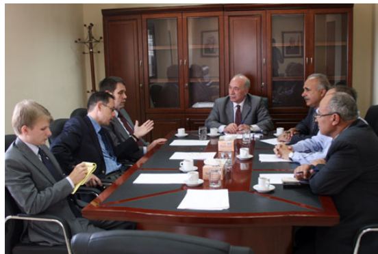
Bureaux de l'agence de presse Wafa à Ramallah (Site Internet de Wafa, 2 juillet 2009)

4. Le 15 juin, l'agence de presse Wafa 1 de l'Autorité Palestinienne a lancé une version hébraïque de son site Internet, jusque-là disponible en arabe, anglais et français. Selon Riyadh al-Hassan , le président du conseil de Wafa, le site Internet hébreu de l'agence ne sera pas une traduction du site en arabe, mais plutôt un site indépendant . Il se concentrera sur les questions d'intérêt des internautes et des médias israéliens, et proposera des informations, des articles et des enquêtes journalistiques se rapportant à tous les secteurs de la vie palestinienne : politique, économie, société et culture. Le site Internet s'adressera également aux Arabes israéliens , puisque ce secteur de la société "joue un rôle toujours croissant dans le dessin de l'avenir du conflit du Moyen-Orient." Riyadh al-Hassan a également précisé que les informations publiées sur le site Internet seront "précises et fiables" et refléteront les idées et les positions du gouvernement palestinien.