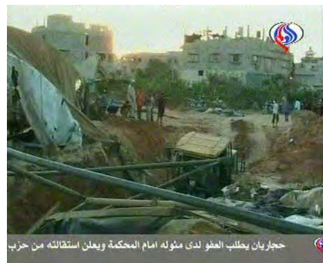
Tunnels de contrebande près de Rafah (au Sud de la bande de Gaza) après la frappe de l'armée de l'air israélienne (25 août 2009)