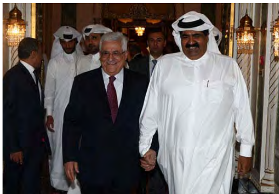
Mahmoud Abbas en visite au Qatar (Agence de presse Wafa, 30 août 2009)

■ Pendant sa visite au Qatar, Mahmoud Abbas a déclaré que "si la construction dans les implantations n'est pas gelée et qu'Israël n'adopte pas de position claire, ces sujets [apparemment l'intention d'organiser le sommet tripartite] sont hors de question" (Télévision Al-Jazeera, 30 août 2009).