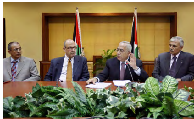
Salam Fayyad présente son plan d'établissement d'un Etat palestinien (Agence de presse Wafa, 26 août 2009)