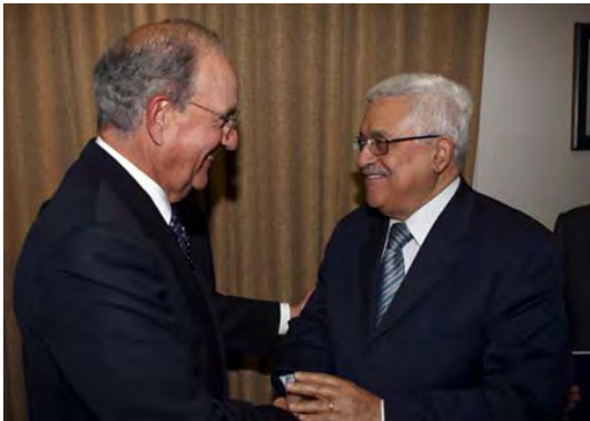
Le Président de l'Autorité Palestinienne Mahmoud Abbas et George Mitchell