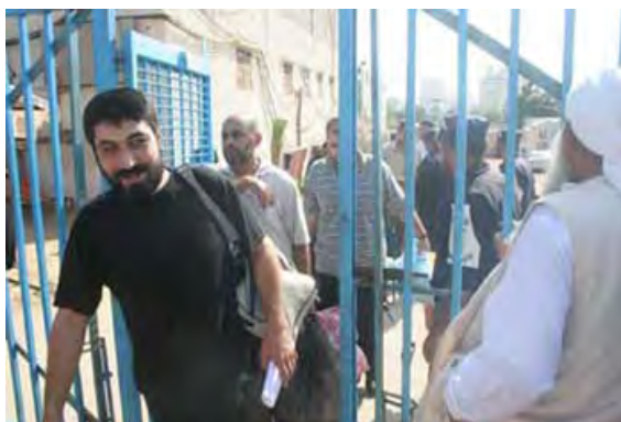
Le Hamas libère des prisonniers à l'occasion de l'Eid al-Fitr (Site Internet du Hamas Palestine-Info, 19 septembre 2009)

■ Le 17 septembre, après le discours, Muhammad Fawzi al-Ghoul , le ministre de la Justice de l'administration de facto du Hamas, a organisé une conférence de presse lors de laquelle il a annoncé la libération de 150 prisonniers criminels et 50 prisonniers sécuritaires à l'occasion de la fête de l'Eid al-Fitr. "Une source de l'administration du Hamas" a déclaré que les 50 prisonniers sécuritaire étaient les membres de l'organisation salafiste Jund Ansar Allah qui avaient été arrêtés après les événements de Rafah (Reuters, Agence France Presse, 17 septembre ; télévision Al-Aqsa, 17 et 18 septembre 2009).