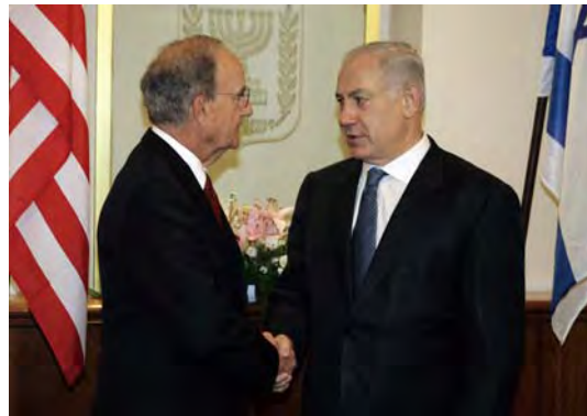
Le Premier ministre israélien Benjamin Netanyahu et George Mitchell, l'émissaire américain au Proche-Orient (Omar Awad, Reuters, 16 septembre 2009)