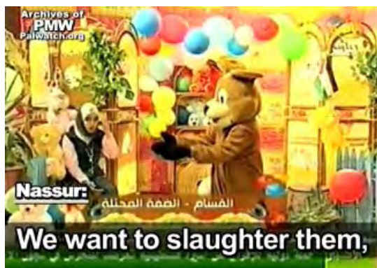
Nassur l'ours : "Nous voulons assassiner [les Juifs] pour qu'ils quittent notre terre, d'accord ?" (Image de la chaîne Al-Aqsa du Hamas, 22 septembre 2009, avec l'aimable autorisation de Palestinian Media Watch)

Le Hamas a récemment diffusé une émission de télévision pour enfants qui a appelé à la mort des Juifs. Le Hamas continue à pratiquer le lavage de cerveau des enfants de la bande de Gaza, prônant la haine et l'utilisation de la violence contre Israël et les Juifs, contredisant ainsi l'image modérée qu'il s'efforce de présenter à l'Occident