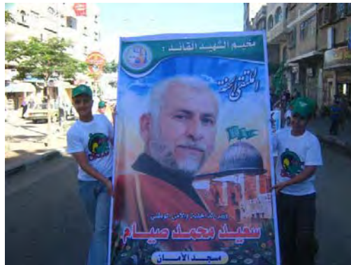
Boys attending a Hamas summer camp and wearing green Hamas caps carry a poster of Sayid Siyam, the late minister of the interior in the Hamas de-facto administration and head of its national security who was killed by the IDF in Operation Cast Lead. The photograph was taken in the Sheikh Radwan neighborhood of Gaza City.