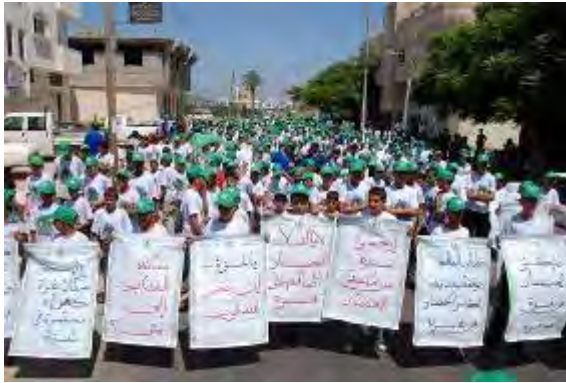
Enfants d'une colonie de vacances du Hamas portant les casquettes vertes du Hamas à une manifestation contre le "siège" israélien de la bande de Gaza (Site Internet des colonies de vacances du Hamas, Eté 2009)