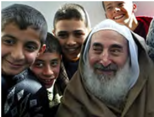
The late Sheik Ahmed Yassin with Palestinian children. He is described as an exemplary figure, the founder and leader of Hamas, killed by the "murderers of the prophets," the "cowardly Jews and Zionists".