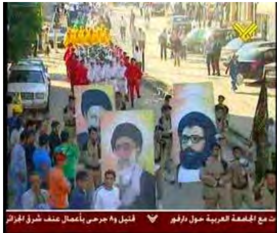
Les Eclaireurs de l'Imam al-Mahdi, le mouvement de jeunesse du Hezbollah, défilant dans une rue au Liban. Les portraits arborés sont ceux de Hassan Nasrallah, Khomeiny et Khamenei (Télévision Al-Manar, 20 octobre 2006).