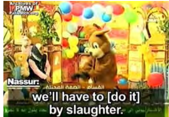
Images des "Pionniers de Demain," l'émission diffusée par la chaîne Al-Aqsa du Hamas le 22 septembre 2009