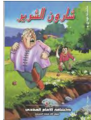
Brochure intitulée "Le Diable [Arik] Sharon" publiée par les Eclaireurs de l'Imam al-Mahdi, le mouvement de jeunesse du Hezbollah. Parmi les autres brochures publiées figurent les "Jeunes du Jihad" et "Sayid Abbas Moussawi, chahid important de la résistance islamique [cf., le Hezbollah].

4. Les quatre annexes suivantes illustrent l'industrie de haine du Hamas destinée aux enfants dans la bande de Gaza :