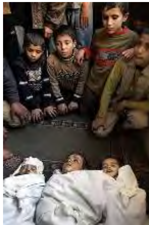
Enfants installés devant des corps de bébés pour leur instiller la haine contre Israël