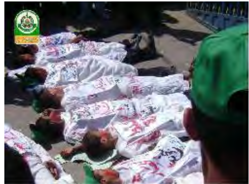
Enfants portant des linceuls pour donner l'impression fausse que le "siège" affame les enfants à mort