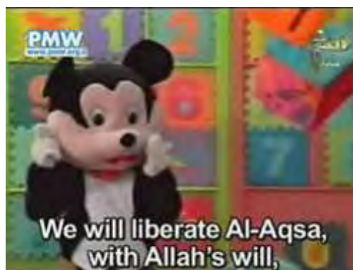
Farfour dans les "Pionniers de Demain" (Télévision Al-Aqsa, 10 mai 2007, avec l'aimable autorisation de Palestinian Media Watch)

9. En Juin 2007, Farfour a été remplacé par Nahool la petite abeille, "la cousine de Farfour." Le personnage de Nahool a été également utilisé comme un outil pour l'incitation à la haine, y compris l'antisémitisme et la glorification des attentats suicide :