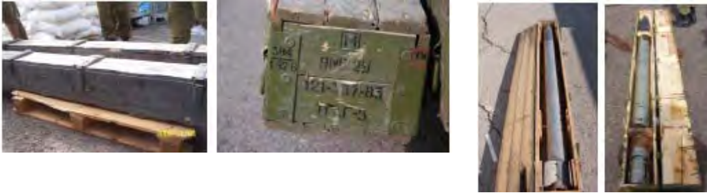
Gauche : Rockettes de 122mm trouvées dans des caisses sur le bateau. Droite : Rockettes semblables trouvées au Liban pendant la seconde guerre du Liban.

iii) Environ 700 détonateurs pour rockettes de 122mm. Les détonateurs étaient neufs.