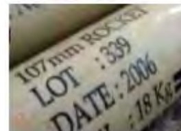
Gauche : Roquettes de 107mm trouvées sur le bateau. Droite : Roquettes semblables trouvées en Irak en 2009. Les deux modèles ont été exportés par l'Iran.