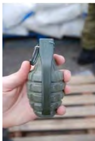
Gauche : Boîte de grenades. Droite : Grenade.

ix) Environ 570 000 munitions d'armes légères pour snipers et mitrailleuses, apparemment fabriquées en Chine.