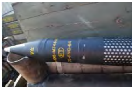
Gauche : Boîtes d'obus d'artillerie, étiquetées en espagnol. Droite : Obus.