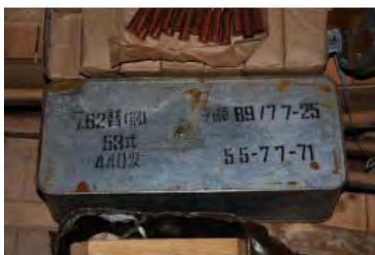
Une des caisses de munitions, étiquetées en chinois.

ix) Environ 570 000 munitions d'armes légères pour snipers et mitrailleuses, apparemment fabriquées en Chine.