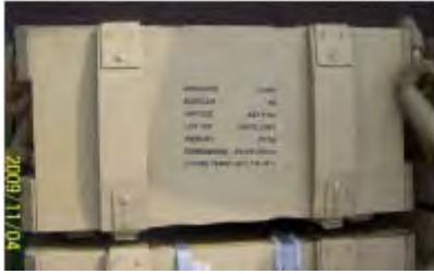
Caisses d'obus de 81mm