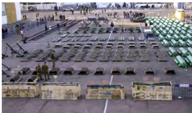
Les armes trouvées sur le Karin-A

i) En Décembre 2001 , le Karin-A était chargé d'armes iraniennes destinées à la bande de Gaza. Il a navigué vers l'Égypte avec l'intention de décharger sa cargaison. De petits bateaux de pêche étaient supposés prendre les armes et les transférer dans la bande de Gaza. Le bateau transportait d'importantes quantités d'armes qui auraient significativement amélioré les capacités des organisations terroristes face à Israël . Il a été saisi par la Marine israélienne le 3 janvier 2002.