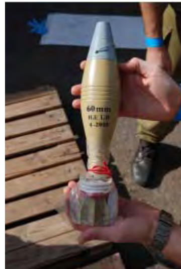
Boîtes d'obus de 60mm trouvés sur le bateau

v) Environ 2 300 obus de mortier de 81mm, d'une portée de 4,7 km. Les obus ont été fabriqués en Iran et étaient neufs.