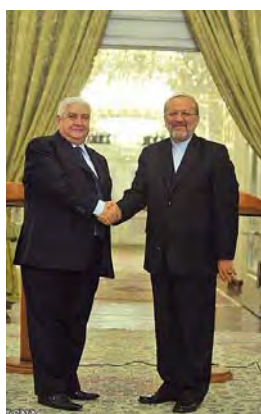
Les ministres iranien et syrien des Affaires étrangères à Téhéran (ISNA, 4 novembre 2009)

6. Un commentateur syrien a refusé de discuter de la destination des armes, tout en soulignant la nature "pirate" de la saisie du bateau, et a demandé aux États-Unis de mettre en application la loi internationale sur les actes de piraterie contre Israël, comme ils le font avec les pirates opérant près des côtes de Somalie (Radio BBC, 4 novembre 2009).