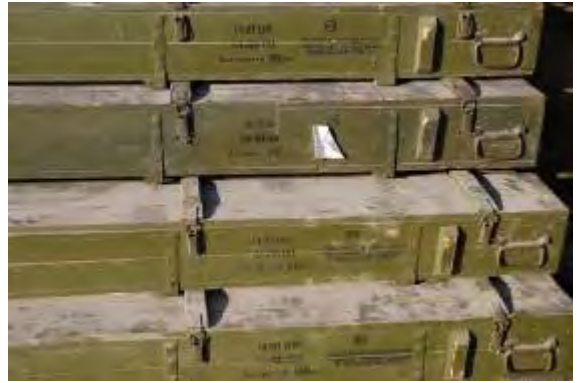
Droite : Quelques-unes des caisses d'armes trouvées sur le bateau. Gauche : Caisses de roquettes de 122mm.

10. Parmi les armes trouvées figuraient :