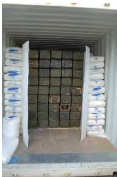
Caisses de roquettes de 122mm.

Un des sacs de polyéthylène utilisés comme camouflage. Selon l'anglais et le farsi, il s'agit d'un produit de la Société Pétrochimique nationale d'Iran, avec le numéro de téléphone 9821 [98 est l'indicatif international de l'Iran] +8788987.