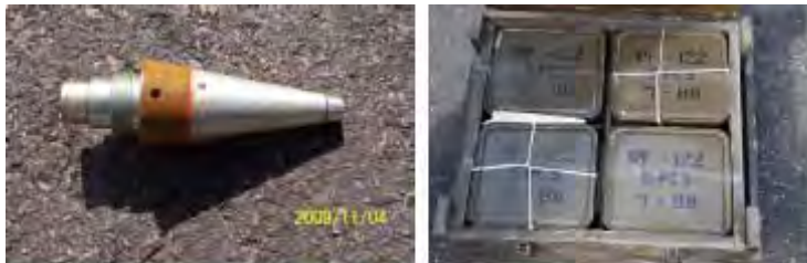
Détonateurs pour rockettes de 122mm

iii) Environ 700 détonateurs pour rockettes de 122mm. Les détonateurs étaient neufs.