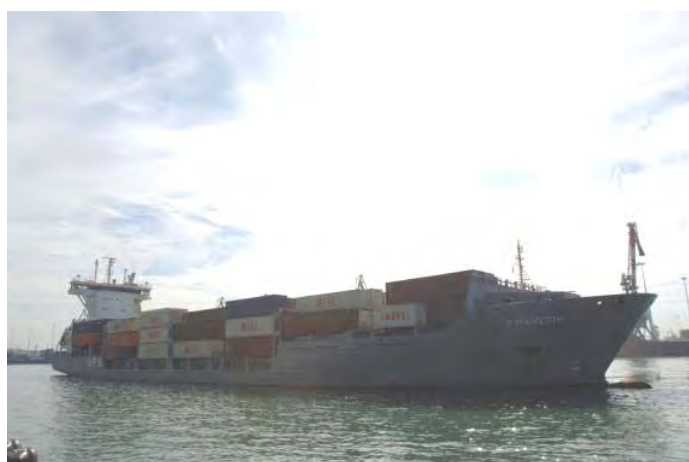
Le Francop, transportant des armes iraniennes, saisi par la Marine israélienne