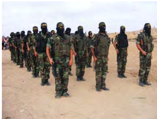
Cérémonie de fin de formation du Jihad Islamique Palestinien (Forum du JIP, 9 novembre 2009)

■ Le 9 novembre, la branche militaro-terroriste du Jihad Islamique Palestinien a organisé une cérémonie de fin de formation pour un groupe de ses membres. Le thème de la cérémonie était "A ton service, mosquée Al-Aqsa." La formation de deux mois a été organisée dans le quartier d'Al-Zeitun de la ville de Gaza et a abordé plusieurs types de formation, y compris l'utilisation de munitions réelles. Le "diplôme" a été délivré en présence de hauts dirigeants du JIP, dont Khaled al-Batash , qui a déclaré que les formations se poursuivraient "jusqu'à ce que les drapeaux de l'Islam et du jihad flottent sur les murs et les minarets de la mosquée Al-Aqsa" (Site Internet du Jihad Islamique Palestinien, 9 novembre 2009).