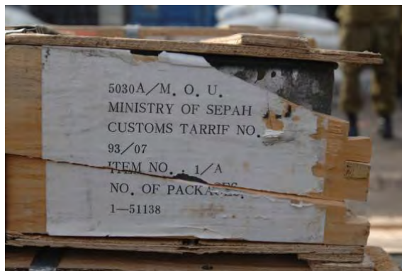
Une des caisses étiquetées SEPAH (Gardiens de la Révolution iranienne)

■ Après sa libération, le bateau s'est rendu au port de Beyrouth, où il a été examiné par la Marine libanaise et la Finul. Des agents des services secrets militaires libanais ont interrogé l'équipage, qui a déclaré que le bateau avait été victime de la "piraterie israélienne," et avait été forcé de modifier son cap pour le port israélien d'Ashdod. Les membres de l'équipage ont précisé que la cargaison aurait dû être déchargée au port syrien de Latakiah (Agence de presse libanaise, 8 novembre 2009).