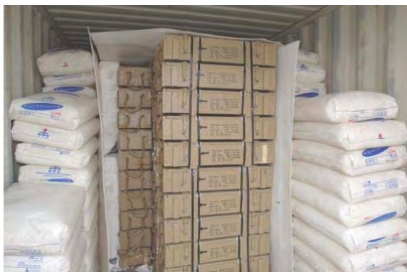
Caisses d'armes camouflées par des sacs de boulettes de polyéthylène.