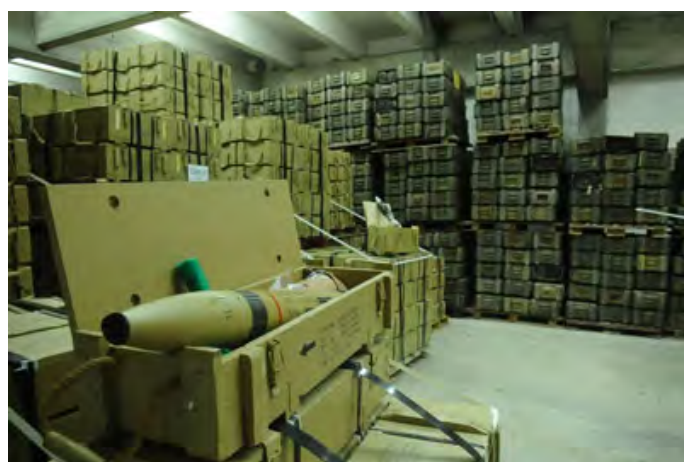
Caisses d'armes saisies à bord du navire (Porte-parole de Tsaah, 5 novembre 2009)