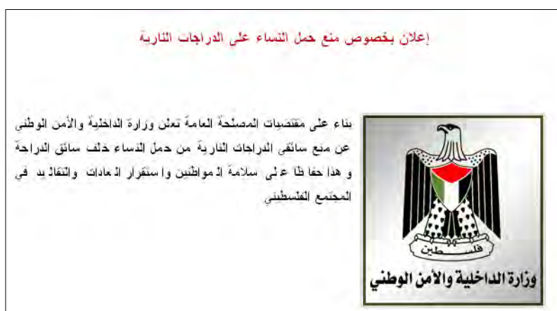
Le communiqué du ministère de l'Intérieur du Hamas interdisant les femmes de rouler à moto.