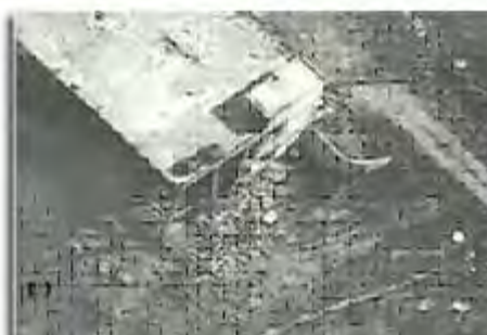
Кадр аэрофотосъёмки здания в деревне Хирбет Салам после взрыва

А) 14 июля 2009 года произошел взрыв в заброшенном здании на окраине деревни Хирбет Салам , расположенной к северу от селения Бинт Джабель (около 15 км от границы с Израилем). Здание в деревне Хирбет Салам использовалось в качестве склада военного снаряжения и, среди прочего, в нём хранились ракетные снаряды, боеприпасы для пулемётов, миномётные мины и артиллерийские снаряды 2 .