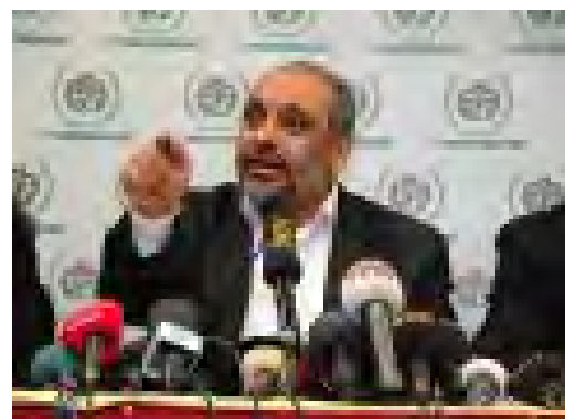
Bulent Yildirim, le responsable d'IHH ( www.ihh.org.tr , 7 avril 2010)