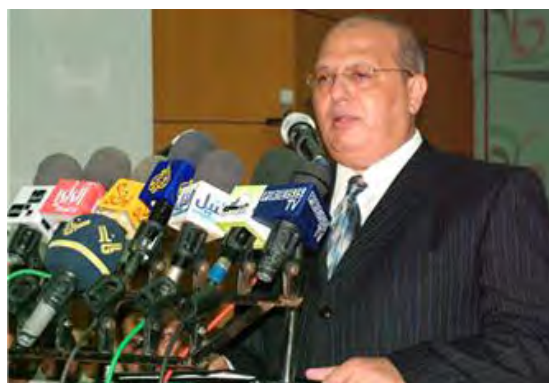
Dr. Jamal al-Khudari, Président du Comité populaire contre le siège de Gaza et membre du Conseil Législatif Palestinien (Ikhwan Online, Site Internet des Frères Musulmans, 5 avril 2010)

1. Début Avril, Jamal al-Khudari a tenu des propos à plusieurs reprises dans les médias sur l'arrivée prévue d'une flotte dans la bande de Gaza (" L'intifada des bateaux "). Ci-dessous des détails sur la flotte ressortant de ses déclarations (Télévision Al-Aqsa, 5 avril ; Agence de presse Safa, 4 avril ; Télévision Al-Quds, 2 avril 2010).