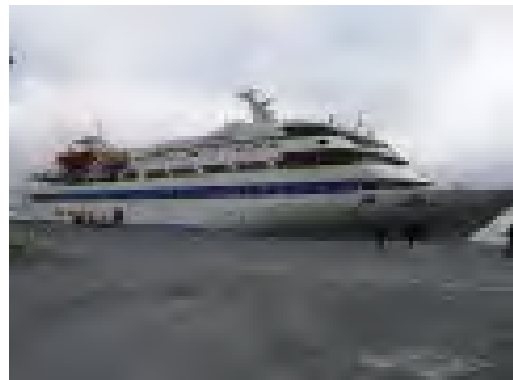
Mavi Marmara, le navire de passagers acquis pour la flotte ( www.ihh.org.tr , 7 avril 2010)