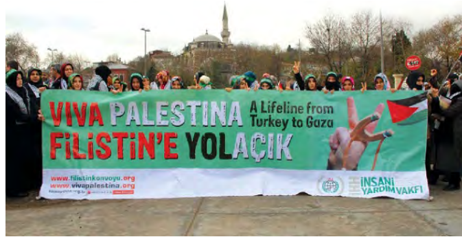
Activistes de l'organisation IHH en Décembre 2009

4. IHH a déjà été déclarée interdite en Israël. Lorsque des activistes de l'organisation ont atterri à l'aéroport Ben Gourion, ils se sont vus refuser l'entrée dans le pays.