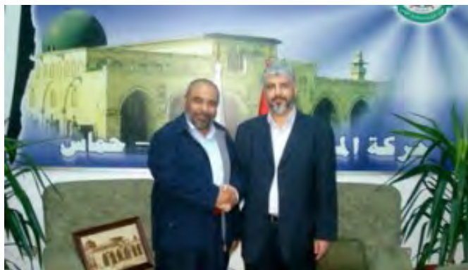
Бюлент Йилдирим и Халед Машаль (январь 2009 г.) 1

8. В январе 2010 года Бюлент Йилдирим посетил Газу, где встретился с Исмаилом Ханийя, главой ХАМАС в секторе Газы.