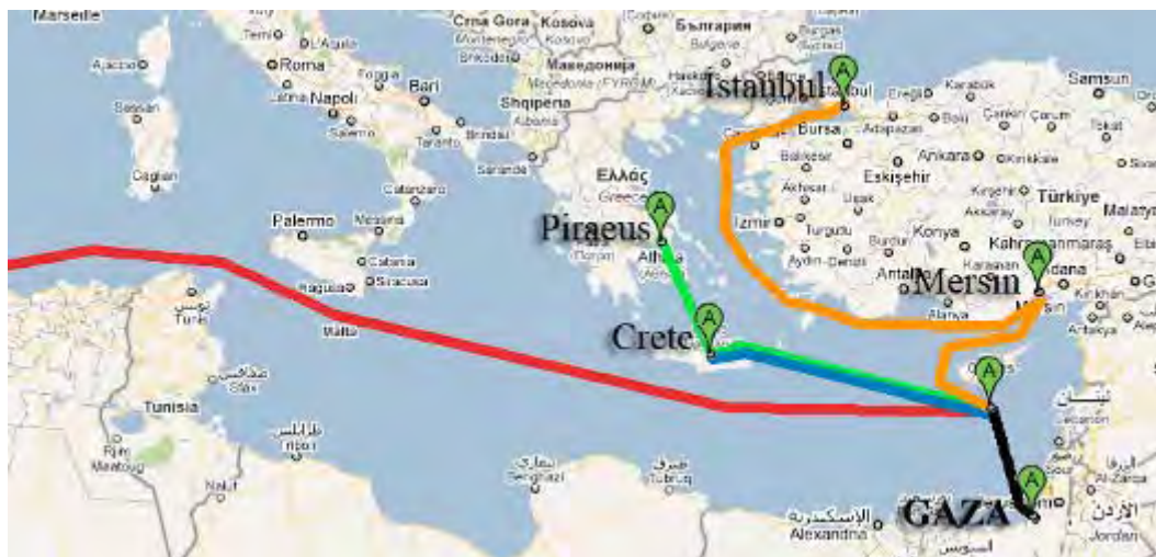
Маршрут флотилии к сектору Газы. Красной линией обозначен маршрут судна "Рэйчел Корри", идущего из Ирландии. 7

20. С этой целью организация ИНН зафрахтовала три судна флотилии (из девяти): пассажирский теплоход "Мави Мармара" и два грузовых парохода (один из которых называется "Газа"). "Мави Мармара" вышел из Стамбула 22 мая по пути в Анталию, где на его борт поднимутся 500 пассажиров. Эти три судна придут из Турции на Кипр, чтобы присоединиться к другим судам флотилии, откуда они все вместе должны направиться в сектор Газы (где, как ожидается, они будут утром 29 мая). Кроме того, в последние несколько месяцев организация ИНН оказывает помощь действующим де-факто министерствам транспорта и общественных работ организации ХАМАС, осуществляя различные проекты в гавани сектора Газы, нацеленные на подготовку к приему судов флотилии (" Филастин аль-Яом ", 19 апреля 2010 г.).