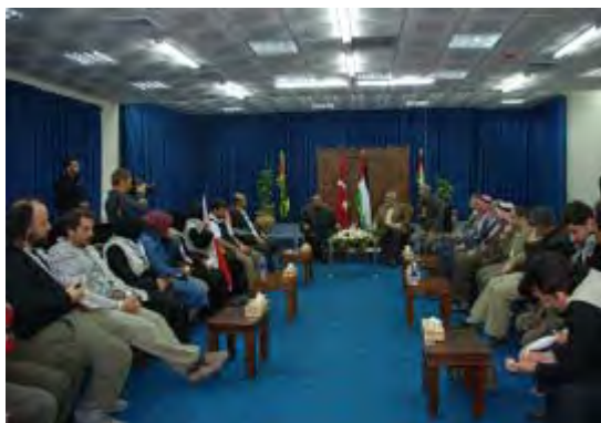
Бюлент Йилдирим встречается с Исмаилом Ханийя и другими высокопоставленными деятелями в секторе Газы (7 января 2010 г.) 2

8. В январе 2010 года Бюлент Йилдирим посетил Газу, где встретился с Исмаилом Ханийя, главой ХАМАС в секторе Газы.