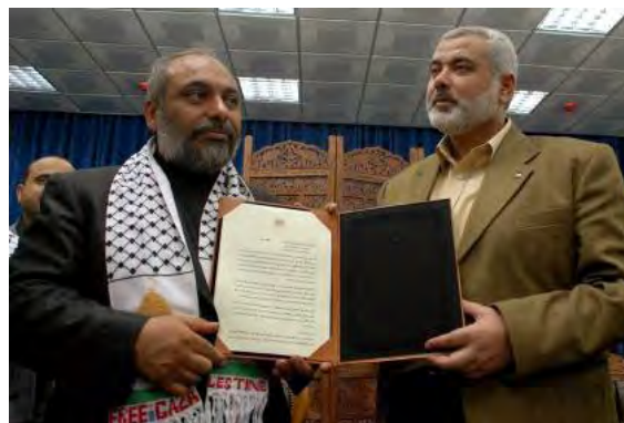
Бюлент Йилдирим и фактический глава администрации ХАМАС Исмаил Ханийя (7 января 2010 г.) 3