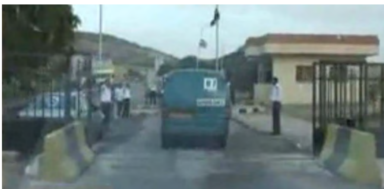
Véhicules du convoi entrant en Syrie (Site Internet Viva Palestina, 5 octobre 2010)

o Le convoi de Jordanie et des États du Golfe se trouve actuellement en Syrie et devrait rejoindre le convoi britannique à Latakieh. Il comprend apparemment 52 véhicules et 134 activistes (Télévision Al-Quds du Hamas et Al-Watan, 4 octobre 2010). Le convoi d'Afrique du Nord a des difficultés à trouver un bateau pour le transporter en Syrie et on ignore si ses activistes ainsi que son équipement pourront prendre la mer. Un groupe d'Algérie a annoncé son intention de se rendre en Syrie par voie aérienne et devrait finalement s'envoler le 5 octobre (Al-Quds Al-Arabi, 28 septembre 2010).