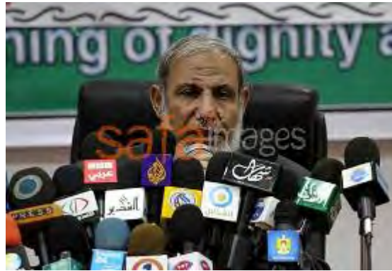
Mahmoud al-Zahar