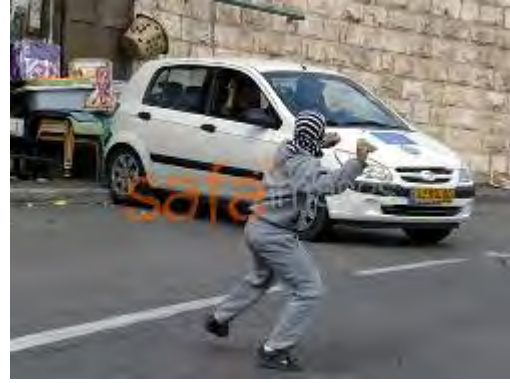
De jeunes palestiniens masqués jettent des pierres sur des véhicules israéliens dans le quartier de Silwan à Jérusalem Est (Site Internet Safaimages, 29 octobre 2010)