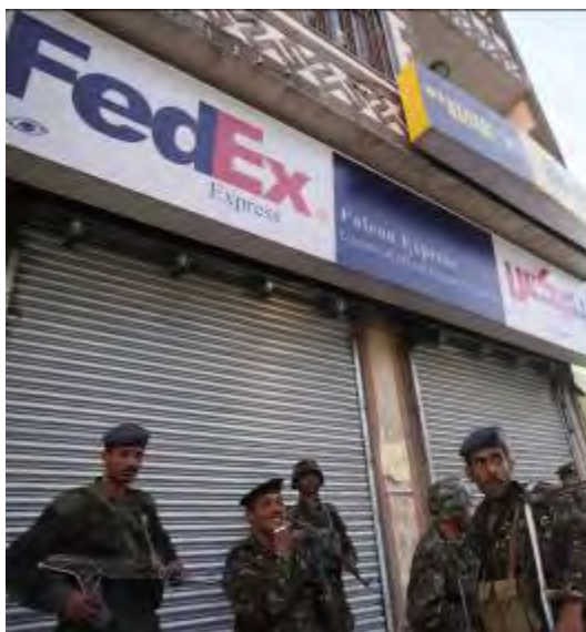
Policiers yéménites postés devant le bureau de FedEx à Sana'a, la capitale, d'où ont été envoyés les paquets piégés aux synagogues de Chicago (Photo: Khaled Abdallah, Reuters, 30 octobre 2010)