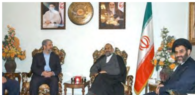
Khaled Mashaal (à gauche) et le ministre iranien des Renseignements (Agence de presse IRNA, 31 octobre 2010)