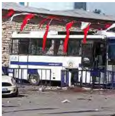
Gauche : Les experts en explosifs de la police examinent le site de l'explosion. Droite : Le site de l'attentat suicide ( http://www.hurriyet.com.tr/gundem/16183201.asp?gid=373 , 31 octobre 2010)