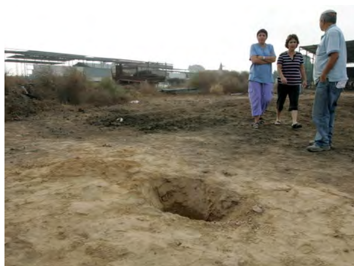
Escalade des tirs de roquettes de la bande de Gaza. A gauche : Impact d'un obus de mortier près d'une base militaire (Avec l'aimable autorisation de la 10ème chaîne israélienne, 19 novembre 2010). A droite : Impact de la roquette Grad (Yehuda Lahiani, NRG, 19 novembre 2010)