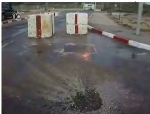
Site de l'impact d'un obus de mortier près d'une base militaire

■ L'ambassadeur israélien aux Nations-Unies a déposé une plainte officielle auprès du secrétaire général concernant le tir de roquettes et l'utilisation de phosphore. Un porte-parole de l'administration de facto du Hamas dans la bande de Gaza a démenti l'utilisation de phosphore (Site Internet du ministère des Affaires étrangères de l'administration du Hamas, 19 novembre 2010 ; Télévision Al-Quds du Hamas, 20 novembre 2010).