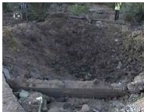
Deux des objectifs terroristes frappés par l'armée de l'air