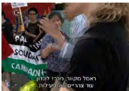
Демонстрация перед магазином Теско с участием активистов PSC

6. В рамках BDS сеть PSC проводит БИТ (бойкот израильских товаров), кампанию бойкота израильской продукции. Активисты PSC постоянно устраивают демонстрации против компаний, импортирующих товары из Израиля, и против магазинов, которые продают их. Они не делают различия между товарами, импортируемыми из Израиля, и товарами из так называемых «оккупированных территорий». Например, они устроили демонстрацию на Рассел-сквер в Лондоне в знак протеста против гигантской сети по продаже продуктов питания Теско (10 канал израильского ТВ, 25.08.2011).