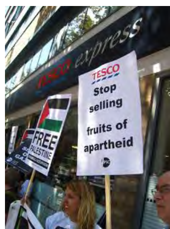
Демонстрация против Теско, устроенная сетью PSC на Рассел-сквер (10 канал израильского ТВ.

7. Согласно статье в британской газете «Телеграф», посвященной участию PSC в бойкотировании Израильского Филармонического оркестра, «Кампания палестинской солидарности (PSC) давно перешла от легитимного протеста в пользу легитимного дела – прав палестинцев на самоопределение – к нападкам на евреев за то, что они евреи». Неудивительно, - продолжает газета, - что Совет депутатов 4 заявил, что антиизраильская риторика PSC «пронизана антисемитизмом» и что члены этой сети «руководствуются теориями расистского заговора». 5 Это совершенно противоречит тому, как PSC позиционирует себя, - как «противника любых форм расизма, в том числе антиеврейских предрассудков» (из вебсайта PSC).