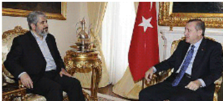
Rencontre entre Khaled Mashaal et Erdogan