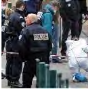
L'attaque contre l'école juive de Toulouse

■ Les circonstances de l'attaque et l'identité du tueur sont toujours inconnues et les enquêteurs et le personnel sécuritaire sont toujours à la recherche de l'assaillant. L'attaque terroriste est liée à des attaques précédentes dans lesquelles des soldats français ont été assassinés. Le Président Nicolas Sarkozy a qualifié l'attaque de tragédie nationale et a déclaré une minute de silence dans toutes les écoles de France. D'autres politiciens français, de gauche comme de droite, ont dénoncé l'attaque.