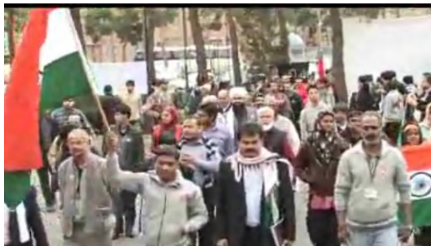
Membres du convoi asiatique dans les rues de Téhéran (Site Internet islamicinvitationturkey.com , 19 mars 2012)

■ Selon des informations sur l'événement au Liban, les points de rassemblement au Sud Liban n'ont pas encore été sélectionnés, mais des points éloignés de la frontière avec Israël ont été déterminés, permettant aux événements d'être contenus. Beaufort, Al-Khayam, Arnon et la Nana Jbeil ont été mentionnés (Télévision palestinienne, 19 mars 2012). Des événements simultanés devraient avoir lieu en Jordanie, en Judée-Samarie et dans la bande de Gaza et peut-être en Syrie. Des rassemblements et des manifestations seront également organisés dans le monde entier, certains devant des ambassades israéliennes.