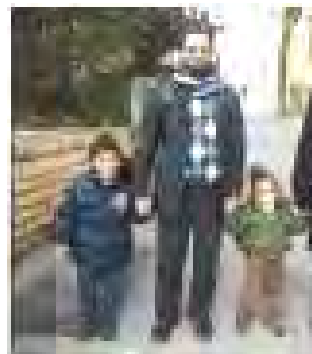
Attaque terroriste antisémite : les quatre victimes de la fusillade dans une école juive de Toulouse en France (Site Internet israel-infos.net, 20 mars 2012)