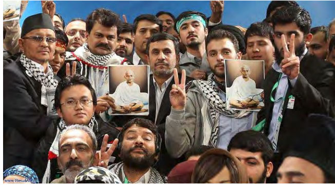
Membres du convoi asiatique photographiés aux côtés d'Ahmadinejad et arborant des portraits de Gandhi (Site Internet proisraelbaybloggers.blogspot, 19 mars 2012)

■ Ahmadinejad a également déclaré que "l'occupation de la Palestine" était un problème historique et que l'existence du régime sioniste était une insulte à la liberté, à la justice et à toutes les nations indépendantes. Il a critiqué les Etats occidentaux, les accusant de faire preuve de tolérance envers l'interrogation de l'existence d'Israël et s'est plaint que "l'Europe et les Etats-Unis dépensent des dizaines de milliards de leurs richesses pour les sionistes chaque année pour aider un régime criminel à poursuivre son occupation". 2