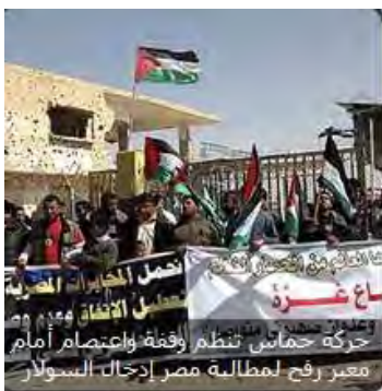
Manifestation dans la bande de Gaza pour la reprise des approvisionnements en essence

■ La pénurie de carburant continue à frapper la bande de Gaza , suite à l'arrêt de l'approvisionnement égyptien. Des douzaines de personnes âgées et de mukhtars ont manifesté au terminal de Rafah, exigeant que l'Egypte fournisse du carburant à la bande de Gaza (Site Internet Paltoday du JIP, 17 mars 2012).