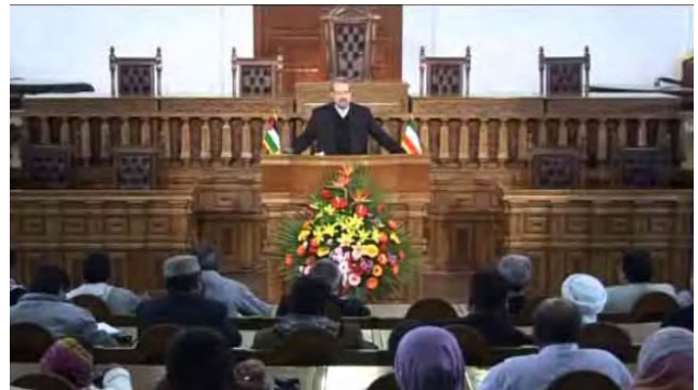
Activistes du convoi asiatique en Iran. Gauche : Rencontre avec Ali Akbar Velayati. Droite : Rencontre avec Ali Larjani (Site Internet islamicinvitationturkey.com, 19 mars 2012)