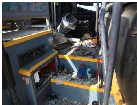
L'autobus scolaire attaqué par un missile antichar du Hamas près de la bande de Gaza (Edi Israel, NRG, 7 avril 2011)