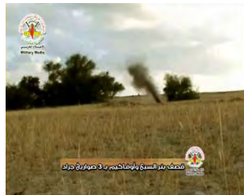
ירי רקטות גראד לעבר באר שבע ואופקים ע"י הג'האד האסלאמי בפלסטין (מתוך סרטון שפורסם באתר פלוגות ירושלים, 13 במרץ 2012)