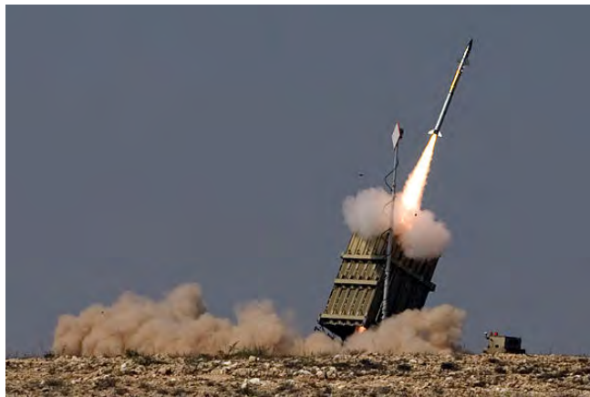
מערכת כיפת ברזל, שהצליחה ליירט מעל ל-50 רקטות ארוכות טווח במהלך סבב ההסלמה האחרון