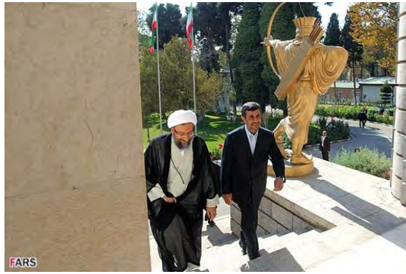
הנשיא אחמדינז'אד וראש הרשות השופטת, צאדק לאריג'אני

אחמדינז'אד התייחס גם לנסיבות, שהובילו להתמודדותו בבחירות 2005, וסיפר, שכאשר הציגו לו לרוץ למשרת הנשיא, הוא אמר ליוזמי ההצעה, שאם אדם פשוט כמוהו יהפוך לנשיא, יהווה הדבר מהפכה נוספת באיראן, שתשים קץ לשלטון האריסטוקרטיה והנפוטזים. הוא הוסיף, כי לאחר שנבחר לנשיאות בבחירות 2005 נאלץ להתחשב בדרישות יריביו ולכלול בממשלתו שרים רבים, שלא היו ממקורביו, כדוגמת שר החוץ לשעבר, מנוצ'הר מתכי (Manouchehr Mottaki).