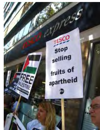
הפגנה בכניסה לסופרמרקט של "טסקו" מצד פעילי PSC