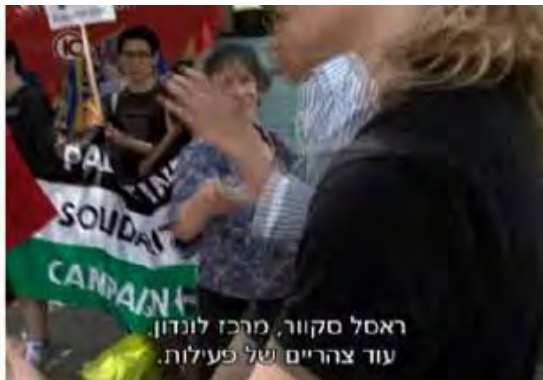
הפגנה בראסל סקוור בלונדון של "PSC" נגד "טסקו" (מתוך תוכנית "המקור", ערוץ 10, 25 באוגוסט 2010).

6. במסגרת הקמפיין להחרמת ישראל מוביל ה-PSC מסע להחרמת תוצרת ישראלית Boycott Israeli Goods (BIG). פעילי PSC נוהגים לקיים הפגנות מחאה נגד חברות המייבאות מוצרים מישראל ונגד מרכולים המוכרים תוצרת ישראלית. בפעילותם זאת הם אינם עושים אבחנה בין מוצרים המיובאים מישראל למוצרים המיובאים מה"שטחים". כך למשל קיימו אנשי הארגון פעילות מחאה בראסל סקוור שבלונדון נגד רשת המזון הגדולה בבריטניה "טסקו", המייבאת מוצרים מישראל (ערוץ 10, תוכנית "המקור", 25 באוגוסט 2010).