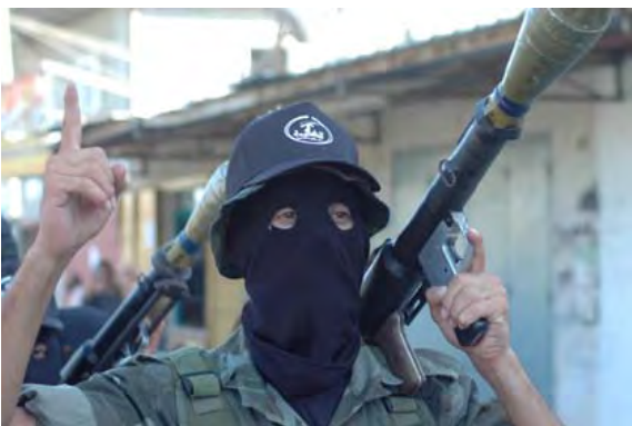
מתוך אתר הארגון: שימוש במטולי אר.פי.גי'י (qaweim.com)