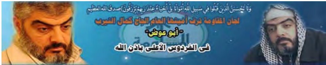
הודעה על מותו של כמאל אלנירב, מנהיג הארגון, בפורום של "ועדות ההתנגדות העממית" (qaweim.com)

א. כמאל אלנירב , שנהרג בתקיפת חיל האוויר, ירש את ג'מאל אבו סמהדאנה והפך למנהיג הפלג המרכזי של ה"ועדות". פלג זה מקיים זרוע צבאית, שכינוייה: "חטיבות אלנאצר צלאח אלדין", והוא משתף פעולה עם חמאס . על פי פרסומי הארגון יש לו מפקדה מרכזית ויחידות שונות כגון יחידת הארטילריה ויחידת הנדסה. לארגון זרוע הסברה ("ההסברה הג'האדית") וזרוע הפועלת באוניברסיטאות בעזה ("גוש ההתנגדות הסטודנטיאלי") 2 .