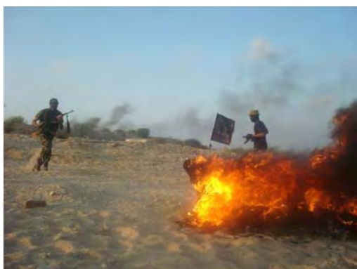
אימונים בנשק חם