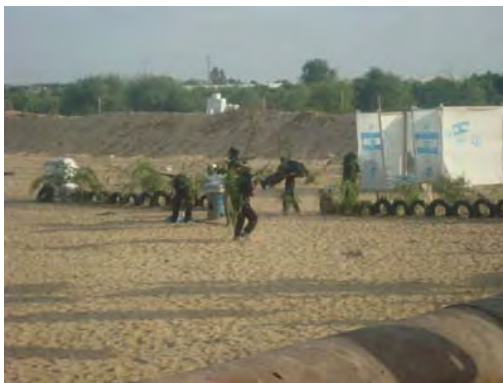
אימון שכלל הנראה נועד לחטיפת חיילים