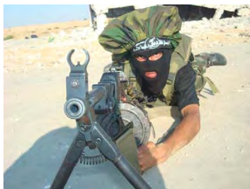
מתוך אתר הארגון: שימוש במקלעים כבדים