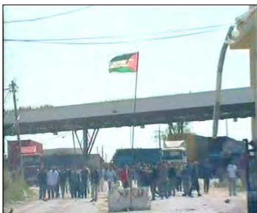
מסוף המטענים קרני מצדו הפלסטיני.

ה. 26 באפריל 2006 – ניסיון פיגוע של "ועדות ההתנגדות העממית" במעבר קרני באמצעות מכונת תופת ומתקפת ירי . הפיגוע, שסוכל ע"י מנגנון הביטחון המסכל הפלסטיני, בוצע בהכוונה של פעילי טרור בכירים של חמאס ברצועה , ובהם אחמד ע'נדור, ראש חמאס בצפון הרצועה ואחמד ג'עברי, מראשי הזרוע המבצעית-טרוריסטית של חמאס ברצועה.