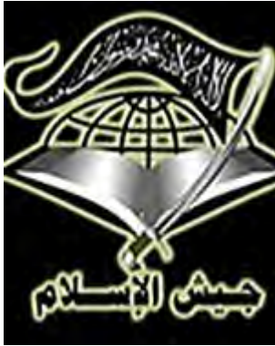
לוגו "צבא האסלאם"

חמאס, שגלש לעימות אלים, והארגון נאלץ לשחרר את אלך ג'ונסטון. כמו כן עמד הארגון מאחורי חטיפות שני כתבי רשת החדשות האמריקאית פוקס ניוז וביצע עשרות רציחות במסגרת חיסולי חשבונות פנים-פלסטינים . כיום "צבא האסלאם" הינו הארגון הגדול והדומיננטי מבין התארגנויות הג'האד עולמי ברצועה, ובעל יכולות מבצעיות גבוהות בהשוואה אליהן.