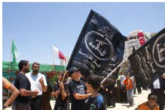
תהלוכה של "ועדות ההתנגדות העממית" בעזה לשם הזדהות עם "צי החירות" [המשט האלים של המאוי מרמרה]