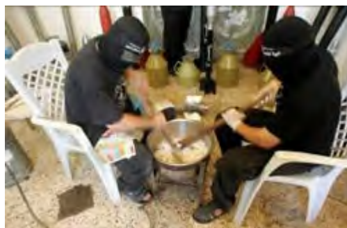
ייצור רקטות במתקן ייצור ביתי ע"י פעילי "ועדות ההתנגדות העממית" בבית מגורים פרטי (שנת 2008)