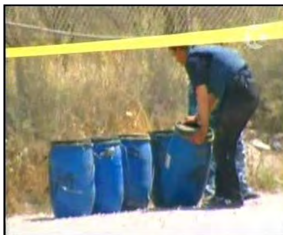
חמש חביות חומרי הנפץ שהיו על מכונת התופת, שהייתה אמורה להתפוצץ במעבר קרני (26 באפריל 2006).