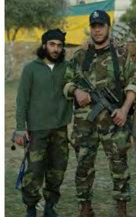
ממתאז דע'מש (מימין) עם אחד מאנשיו (אתר האינטרנט של חמאס, 21 בינואר 2007).