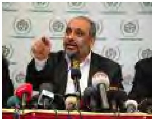
מנהיג ה-IHH בולנט ילדרים (7 באפריל 2010 www.ihh.org.tr )

2. בראש הארגון עומד עורך דין בשם בולנט ילדרים , המתגורר באיסטנבול, בעל תפיסת עולם אנטי-מערבית, אנטי-ישראלית ואנטישמית (המתבטאת היטב בנאומים המתלהמים שלו). לבולנט ילדרים קשרים הדוקים עם ראש ממשלת תורכיה ארדואן ועם צמרת הממשל התורכי. בולנט ילדרים (יחד עם צמרת IHH) שהה על גבי ה"מרמרה" וארגן וניהל את העימות האלים של פעילי IHH נגד צה"ל.