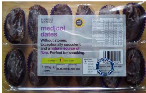
קריאה להחרמת מוצרים ישראליים (תמרים) ע"י ארגון "זכויות לכל" – ג'נבה ( http://www.aqsa.org.uk )

30. לדברי מארגני המשט הספינה שתצא מטעם "זכויות לכל" תקרא – Freedom Flotilla "Stay Human" והיא תוקדש לזכרו של העיתונאי ופעיל ISM האיטלקי ויטוריו אריגוני (פעיל פרו-פלסטיני שנרצח ב-14 באפריל 2011 ברצועת עזה ע"י התארגנות המזוהה עם הג'יהאד העולמי).