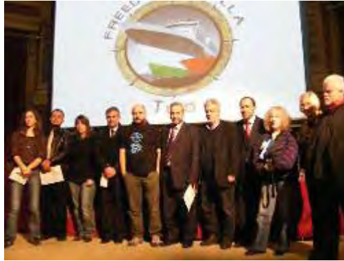
משתתפי ישיבת ועדת ההיגוי שהתקיימה ברומא (אתר המשט, 24 בפברואר 2011)

4. שלושת "ארגוני הליבה" הללו הם שמתווים את המדיניות והאסטרטגיה של המשט (כפי שעשו בארגון משט ה"מרמרה"). זאת, באמצעות וועדת ההיגוי (Steering Committee), שהוקמה לצורך ארגון המשט הנוכחי, המקיימת מעת לעת ישיבות תיאום בהשתתפות פעילים בכירים משלושת "ארגוני הליבה" ומארגונים אנטי-ישראלים נוספים. עד כה התקיימו ישיבות תיאום כאלה באתונה, פריס, אמסטרדם, מדריד וברומא.