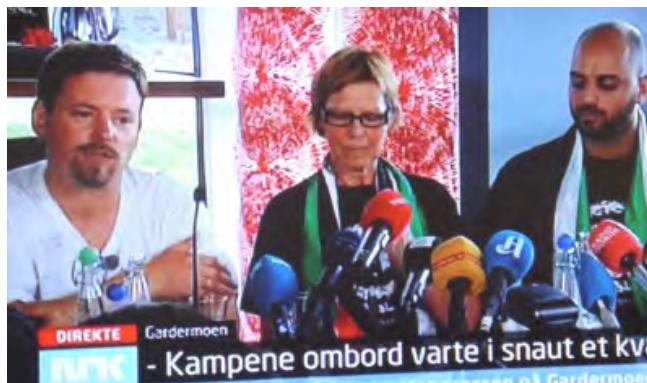
מסיבת עיתונאים באוסלו של שלושה פעילים נורווגים שהיו על גבי ה"מרמרה". במשט הראשון (newsinenglish.no, 28 באפריל 2011)