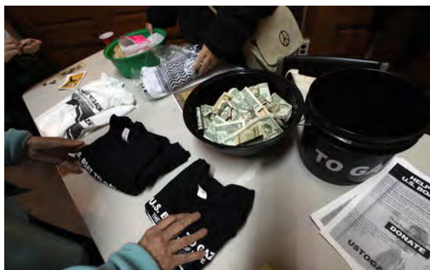
איסוף תרומות בארה"ב עבור המשט

56. לשם השתתפות המשט הנוכחי הוקמה קואליציה של ארגונים ופעילים בעלי אופי אנטי-ישראלי. הקואליציה מתכננת לשגר ספינה בשם "The Audacity of Hope", שתפליג תחת דגל ארה"ב. פעילים רבים בקבוצה הם יהודים. פעילי הארגון טוענים כי הספינה האמריקאית תהייה בעמדה ייחודית להתמודד עם מדיניות החוץ של ארה"ב ולהבטיח את המחויבות הבינלאומית לשמירה על החוק הבינלאומי ועל זכויות האדם. אנשי המשט מתחייבים שלא ינהגו באלימות ומטען הספינה יהיה פתוח לבדיקות בינלאומיות 13 .