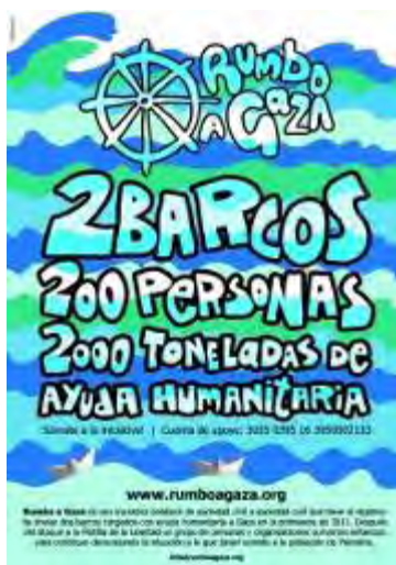
פוסטר הקורא לקחת חלק במשט : "200 אנשים 2,000 טונות סיוע הומניטארי"

40. ב-22 במאי 2011 קראו פעילי ההתארגנות לממשלת ספרד שלא להיכנע ללחצים הישראליים למניעת יציאת המשט ולהבטיח את שלומם של נוסעי הספינה והסיוע ההומניטארי שעל סיפונה (Freedomflotilla.eu, 22 במאי 2011). הפעילים התלוננו בבית משפט ספרדי, כי המשמר האזרחי הספרדי עצר את מכוניתו של דובר הארגון וערך חיפוש בכליו (rebellion.org, 22 באפריל 2011).