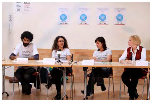
פעילי ההתארגנות מכנסים מסיבת עיתונאים

33. מסגרת ארגונית עבור ארגונים ופעילים בלגיים פרו-פלסטינים המעוניינים להצטרף למשט ל"הסרת המצור" מעל רצועת עזה. אנשיה מקיימים קמפיין תקשורתי על מנת לרכוש ספינה שעלותה עומדת על 300,000 אירו. למסגרת זאת זיקה ל Free Gaza Movement (FGM). יוזכר, כי על גבי ה"מרמרה" היו רשומות שלוש נשים בעלות אזרחות בלגית, אחת מהן התחרטה ברגע האחרון ולא עלתה על הספינה.