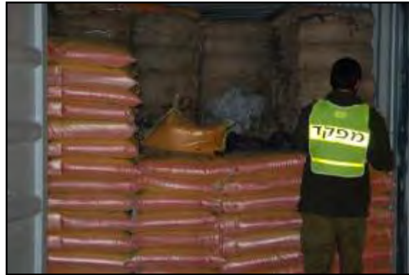
אמצעי הלחימה מוסוים מאחורי שקי כותנה ועדשים