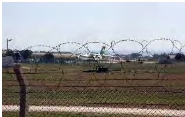
המטוס האיראני בנמל התעופה בדרום מזרח תורכיה (cihan, 16 במרץ)