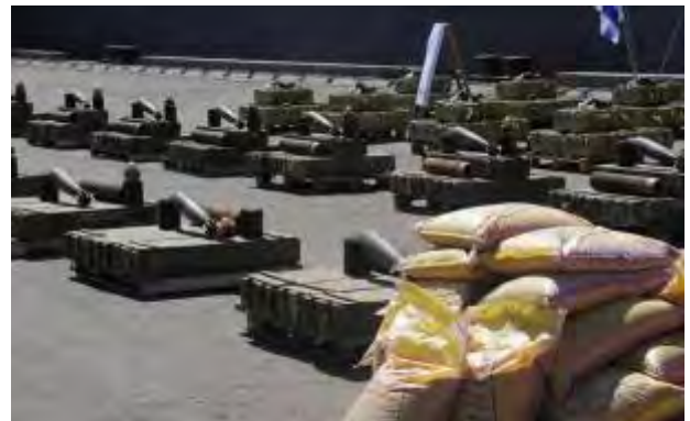
FARS NEWS AGENCY

אמצעי לחימה, שנמצאו על גבי הספינה (דובר צה"ל, 16 במרץ 2011). בתמונה השמאלית התחתונה: שר ההגנה האיראני ואחידיו בוחן טילי חוף-ים C-704 במפעל היצור באיראן (סוכנות פארס, 7 במרץ 2010)