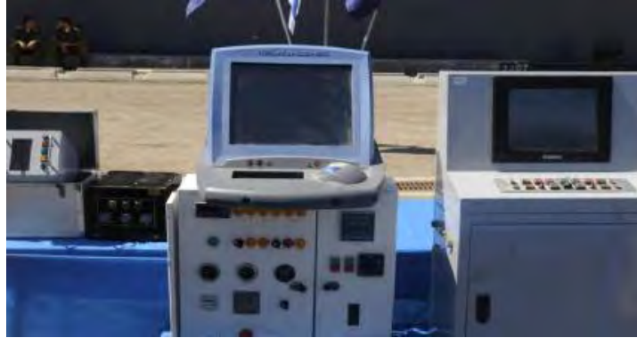
עמדות מכ"ם ושליטה ובקרה שנמצאו על גבי הספינה (דובר צה"ל, 16 במרץ)