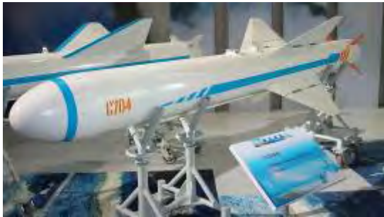
טיל חוף-ים C-704 (Fresh.co.il, 16 במרץ 2011)

הנחיה: הטיל הינו מסוג "שגר ושכח" בעל ניווט מכ"מי.