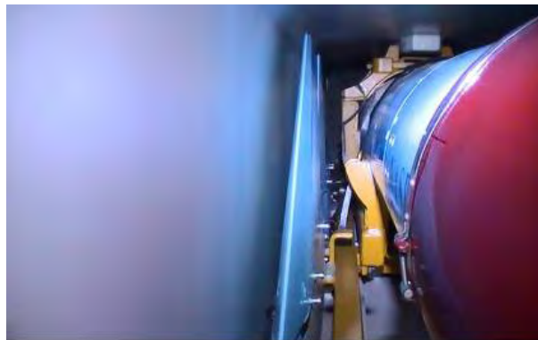
אחד מטילי חוף-ים C-704 שנמצאו על גבי סיפונה (16 במרץ 2011)