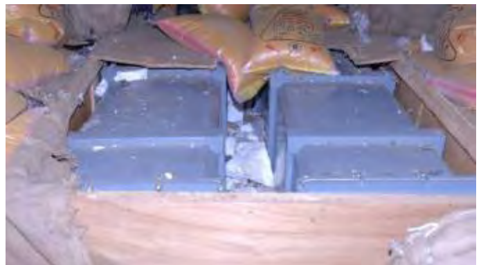
טילי חוף-ים שנמצאו על גבי הספינה (דובר צה"ל, 16 במרץ 2011)