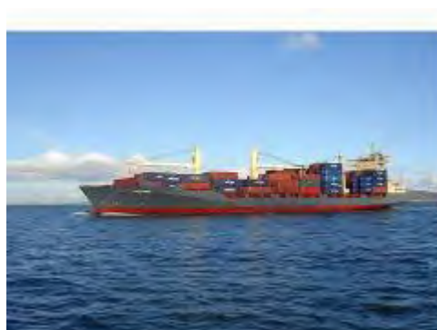
מימין: הספינה "ויקטוריה" (תמונת ארכיון ממשאל: marintraffic.com). משמאל: הספינה "ויקטוריה" מובלת לנמל אשדוד (דובר צה"ל, 15 במרץ 2011)