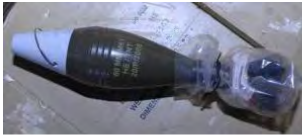
פצצת מרגמה 60 מ"מ