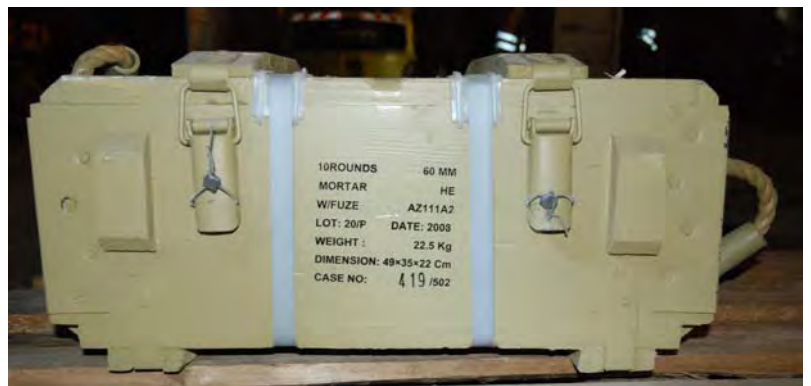
ארגז פצצות המרגמה, שנמצא על גבי הספינה