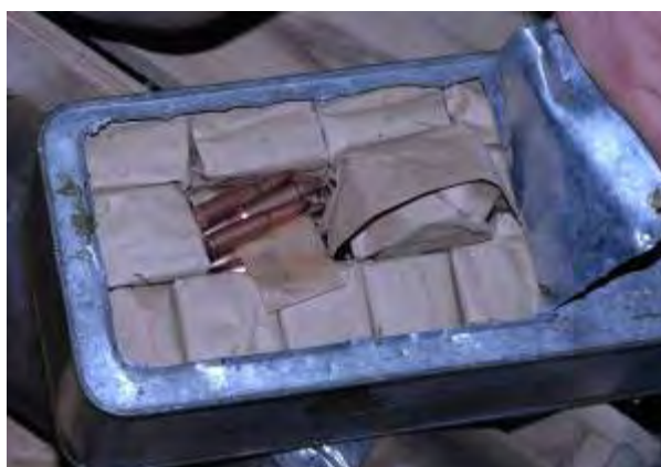
כדורי קלצ'ניקוב בקוטר 7.62, שנמצאו על גבי הספינה