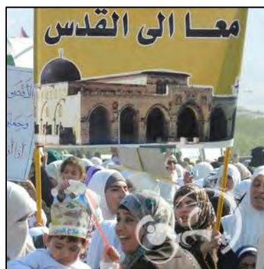
נשים נושאות כרזה שעליה נכתב: "יחד אל ירושלים"