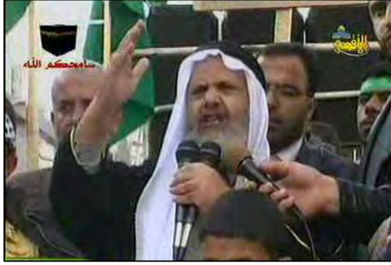
של תנועת האחים המוסלמים בירדן, במהלך תהלוכת הזדהות עם תושבי רצועת עזה (5 בדצמבר 2008, ערוץ אלאקצא של חמאס).

59. תנועת האחים המוסלמים בירדן ממלאת תפקיד מרכזי בגילויי המחאה נגד המשטר ההאשמי . מחאה זאת, מתקיימת בשלב זה, "על אש קטנה" ומתבטאת בעיקר בהפגנות בימי שישי בהם משתתפים כמה אלפי איש. מרכזיותה של התנועה בולטת בעיקר בעמאן ולעתים גם בצפון (נפת ארביד). תנועת האחים המוסלמים פועלת כחלק מקבוצות מחאה אחרות מתנגדי המשטר כגון גורמי שמאל, קבוצות אסלאמיות שאינן משתייכות לתנועה, ליברלים ואנשי הזרם הפן-ערבי. בדרום ירדן חברה תנועת האחים המוסלמים לקבוצות מחאה שמקורן בשבטים הדרומיים.