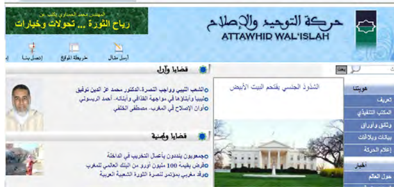
עמוד הבית של אתר תנועת ייחוד האל והרפורמה, המזוהה עם האחים המוסלמים במרוקו

142. תנועת ייחוד האל והרפורמה 57 , המזוהה עם תנועת האחים המוסלמים במרוקו, הוקמה בשנת 1996. אליה הצטרפו תנועות אסלאמיות שונות, שהוקמו החל משנות השבעים. הזרוע הפרלמנטרית של התנועה נקראת מפלגת הצדק והפיתוח (PJD) 58 . זוהי תנועה אסלאמית מתונה העוסקת בעיקר בפעילות חינוך ובעשייה חברתית (דעוה). התנועה מצדדת בדמוקרטיה, פלורליזם, משולבת פוליטית במוסדות המשטר המלוכני 59 .