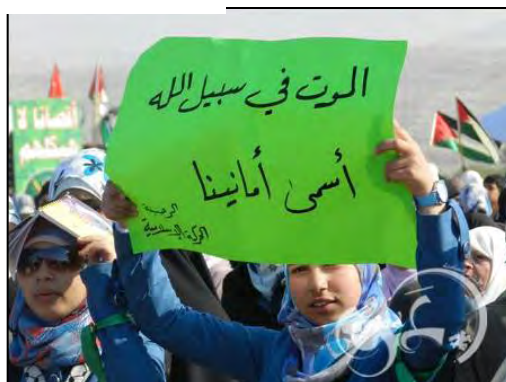
נערה נושאת כרזה שעליה כתוב "המוות למען אלה הוא השאיפה הנעלה ביותר שלנו" (חלק מסימת תנועת "האחים המוסלמים", המופיעה בסמל האחים המוסלמים בירדן; "אללה הוא תכליתנו; השליח [הנביא מחמד] הוא המופת שלנו; הקוראן הוא החוקה שלנו; הג'אהד הוא דרכנו; המוות למען אלה הוא הנשגב שבמשאלותינו")