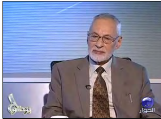
עלי צדר אלדין אלביאנוני: המפקח הכללי של תנועת האחים המוסלמים בסוריה בשנים 2010- 1996 (16 בנובמבר 2009, ערוץ האחים המוסלמים בלונדון אלחואר)

51. בפברואר 2011, בעקבות האירועים הדרמטיים בתוניסיה ובמצרים, פתחה תנועת האחים המוסלמים במתקפה תקשורתית מחדשת נגד המשטר הסורי . היא קראו לו להפסיק את כל צעדי הדיכוי נגד העם הסורי והביעה ביקורת קשה על מצב העוני, הרעב והאבטלה