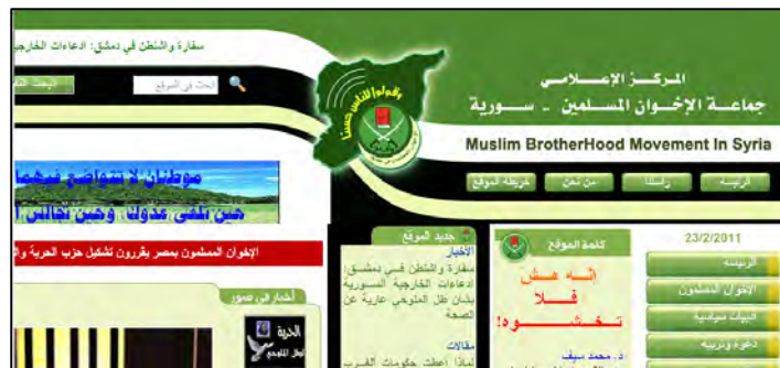
אתר האינטרנט של תנועת האחים המוסלמים בסוריה ( ikhwansyria.com )

47. עם עלייתו של בשאר אלסד (בשנת 2000) קיימה התנועה מגעים עם המשטר הסורי, ומאות מפעיליה שוחרו מהכלא. אולם עד מהרה פסקו מגעים אלה והחל משנת 2004 פעלה התנועה ביתר שאת כדי לשכנע את העם הסורי ומדינות המערב שיש להפיל את המשטר הסורי.