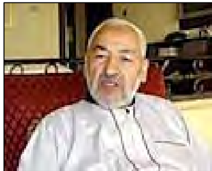
ראשד אלע'נושי (globalmbreport.org, 31 בינואר 2011)

158. ראשד אלע'נושי, מנהיג תנועת אלנהאדה התוניסאית, נולד בשנת 1941, בדרום מזרח תוניסיה. בצעירותו למד במוסדות חינוך מסורתיים. ע'אנושי שלא דיבר צרפתית התקשה