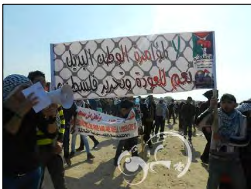
כרזה ועליה כתוב "לא למזימה של המולדת החלופית, כן לשיבה ולשחרור פלסטין" (ammonnews.net)