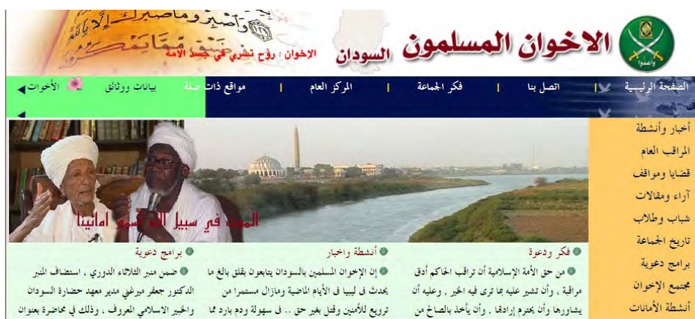
אתר תנועת האחים המוסלמים בסודאן (אתר התנועה באינטרנט, מרץ 2011).