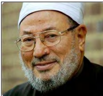
שיח' יוסף אלקרצ'אוי (Palestine-info, 15 באוגוסט 2010)

נגד ישראל והיהודים, ובעבר הוא נתן הכשר דתי לפיגועים נגד מטרות אזרחיות, גם אם הם מכוונים נגד נשים וילדים. הוא רואה בכל שטחי פלסטין אדמת הקדש מוסלמית, מתנגד בחריפות לקיומה של מדינת ישראל, שולל את הסכמי השלום עמה ומתנגד לרשות הפלסטינית. את עמדותיו אלו הוא מפיץ ברחבי העולם הערבי/אסלאמי באמצעות כלי התקשורת האלקטרוניים, בדגש על ערוץ אלג'זירה הקטרי, המנוצל על ידו להסתה קשה נגד ישראל ונגד העם היהודי.