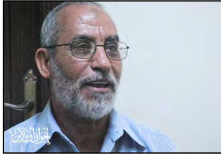
מחמד בדיע, המדריך הכללי של תנועת "האחים המוסלמים" העולמית

10. בתקופה שלאחר סילוק משטר מבארכ, הפכה תנועת האחים המוסלמים במצרים לכוח פוליטי לגיטימי המאורגן ביותר בקרב הציבור. ביטוי פוליטי לכך, ניתן למצוא בניצחונם הסוחף של התנועה בשני סבבי הבחירות (מבין שלושה) למועצת העם (הגוף התחתון של הפרלמנט): עפ"י הפרסומים, זכתה מפלגת "החירות והצדק" של תנועת האחים המוסלמים בסיבוב הראשון בכ-40% מהקולות, והמפלגות הסלפיות (המייצגות אידיאולוגיה נוקשה ואולטרא שמרנית של האסלאם) זכו ל-20% מהקולות (בעוד שתנועות המחאה הליברליות השותפות לאירועי כיכר תחריר נחלו כישלון נחרץ). עפ"י דיווחים תקשורתיים, זכו האחים המוסלמים בכ-47% בסבב הבחירות השני ומפלגת "אלנור" הסלפית זכתה בכ-20%.