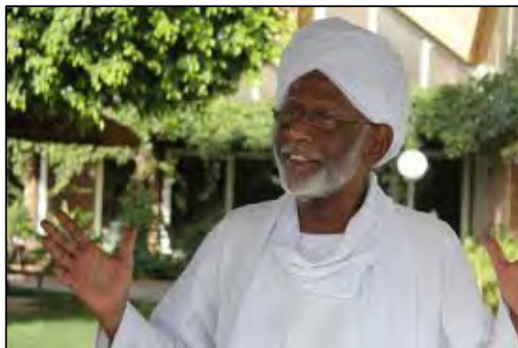
עבדאללה חסן אלטרابی

111. עבדאללה חסן אלטרابی הנו איש דת מוסלמי סוני, שביסס בחלקים רבים בסודאן את חוקי ההלכה האסלאמיים. הוא נולד בשנת 1932, בעיר קסלה שבצפון מזרח סודאן כבנו של שיח' מהזרם הצופי. בילדותו זכה לחינוך אסלאמי מסורתי. למד משפטים בח'רטום ובאוקספורד והוסמך כדוקטור למשפטים מטעם אוניברסיטת סורבון בפריס. בתחילת שנות החמישים של המאה הקודמת נמנה אלטרابی על גרעין המייסדים של הפלג הסודאני של תנועת האחים המוסלמים. אלטרابی עמד בראש התנועה בסודאן ושימש כמפקח כללי שלה בשנים 1964-1967 ו-1969-1979 37 , ובהמשך היה הדמות הבולטת בקרב תנועת האחים המוסלמים.