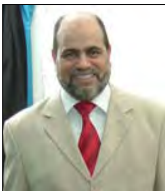
בוג'רה סלטאני (אתר חרכת מג'תמע אלסלם, 24 בפברואר 2011)

88. בראשית שנות התשעים, בעקבות כינונה של מערכת רב-מפלגתית באלג'יריה, הקימו האחים המוסלמים באלג'יריה מפלגה בשם התנועה לחברה של שלום (MSP 21 ). הייתה זו מפלגה אסלאמית מתונה , שקיבלה את "כללי המשחק" שהמשטר הכתיב לה, ושולבה היטב במערכת השלטונית (היא היוותה חלק מברית מפלגות שתמכו בנשיא בותפליקה). היא לא הגדירה עצמה במסמכיה המרכזיים כשלוחה של האחים המוסלמים באלג'יריה, אך בהחלט הייתה מזוהה עמם 22 . מנהיגה היה מחפוז נחנאח , עד למותו בשנת 2003, שנחשב לדמות חזקה וכריזמטית. בשנת 1995 היה נחנאח מועמד לנשיאות, אך הגיע למקום שני עם כ-25% תמיכה. את נחנאח ירש בוג'ארה סלטאני , אשר נתפס כדמות חלשה יותר מקודמו.