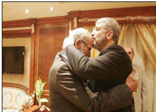
ח'אלד משעל ראש הלשכה המדינית של חמאס (מימין) ומחמד בדיע המדריך הכללי של האחים המוסלמים, בפגישתם בקהיר, 10 באוגוסט 2011 (www.janobiyat.com)

20. עדויות להשפעת הטלטלה האזורית ניתן למצוא גם בזירה הפלסטינית , אצל חמאס, תנועת הבת הפלסטינית. אחד הביטויים הבולטים לכך הנו הידוק הקשרים הפומביים בין תנועת האחים המוסלמים במצרים , לבין תנועת חמאס. במהלך שנת 2011, התקיימו כמה פגישות בקהיר בין בכירי האחים המוסלמים במצרים לבין הנהגת חמאס, הרואה בהן מנוף לחיזוק מעמדה מול הצבא והממשל המצרי כמו גם מול פתח והעולם הערבי 2 . ביטוי נוסף להשפעת הטלטלה האזורית על חמאס, הנו התהליך (שעדיין לא הסתיים) של עזיבת המפקדה בדמשק ושל עקירת הנהגת חמאס למדינה או למדינות אחרות 3 .