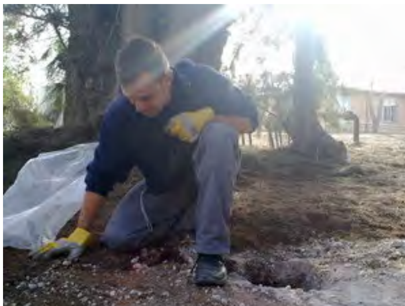
אתר פגיעת הרקטה, שנורתה ב-21 בדצמבר לעבר הנגב המערבי (באדיבות NRG, אדי ישראל, 20 בדצמבר 2010)