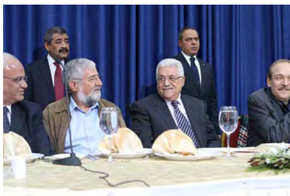
אבו-מאזן (מימין) ועמרם מצנע בעת ביקור המשלחת הישראלית בראמאללה (ופא, 19 בדצמבר 2010)

■ מנגד, אבו מאזן , יו"ר הרשות הפלסטינית, אירח בראמאללה משלחת של כמאה ישראלים, ובהם חברי כנסת מטעם המפלגות "קדימה", "העבודה" ו"מרץ", פעילי "הליכוד" וחברי הכנסת לשעבר עמרם מצנע ואפרים סנה. בנאומו באירוע הדגיש אבו מאזן כי הפלסטינים "מוכנים לדבר כמה שיותר" וכי הפתרון היחיד לסכסוך הינו מו"מ . הוא הוסיף, כי נעשה שינוי תפיסתי מאלימות לאי אלימות וכי הוא אינו מעוניין בשפיכות דמים (ופא, 19 בדצמבר 2010).