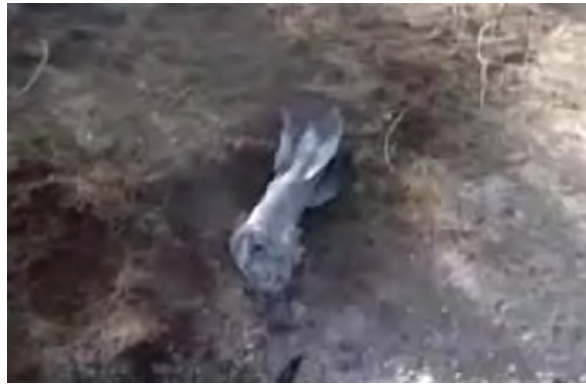
הרקטה שנפלה בקיבוץ במועצה האזורית חוף אשקלון (באדיבות ערוץ 10, 21 בדצמבר 2010)

■ השבוע אותרו נפילות של חמש עשרה פצצות מרגמה בנגב המערבי. ב-20 בדצמבר נורו שתיים עשרה פצצות מרגמה, שנפלו בשטחים פתוחים במועצה האזורית אשכול. ב-19 בדצמבר שלוש פצצות מרגמה נפלו בשטחים פתוחים במועצות האזוריות אשכול וחוף אשקלון. לא היו נפגעים ולא נגרם נזק. וועדות ההתנגדות העממית נטלו אחריות על האירועים (אתר הזרוע הצבאית של וועדות ההתנגדות העממית, 19 ו-20 בדצמבר 2010).