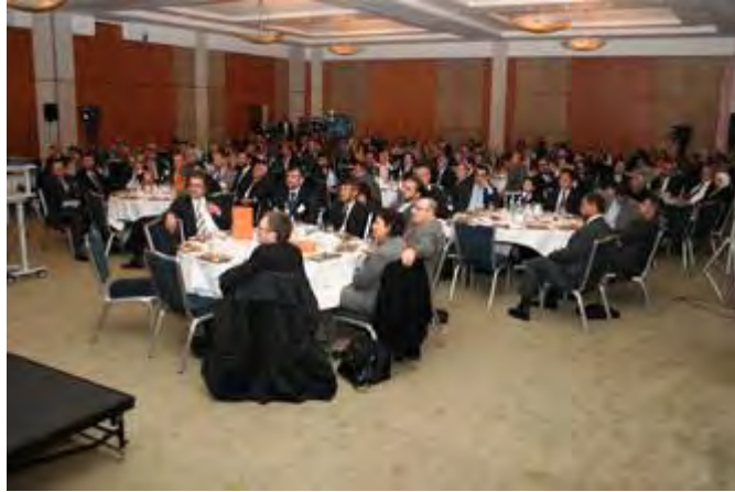
צילום מהאירוע לרגל עשור להקמת PRC (אתר PRC, פברואר 2007)