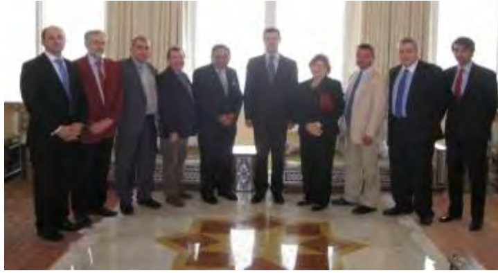
משלחת פרלמנטארית בריטית, שביקרה בסוריה בתאום עם PRC מצטלמת בחברת נשיא סוריה בשאר אלאסד.

ב. PRC חותר להטמיע בקרב הציבור הבריטי את המודעות לבעיית הפליטים ו"זכות שיבה". לשם כך, על-פי אתר המרכז, הוא ארגן מאז הקמתו "עשרות כינוסים, סדנאות, הרצאות וסמינרים" בהם השתתפו מומחים, פרשנים ודיפלומטים בעלי שם בזירה הבינלאומית". כך, למשל, באחד הכינוסים שארגן PRC, שדן ב"זכות השיבה וההתנגדות הפעילה להתנחלות", השתתפו "שרים מהמזרח-התיכון, אקדמאים ומשתתפים רבים מכל רחבי העולם". 15 כינוסים אחרים עסקו בהשחרת הדימוי של מדינת ישראל באמצעות מה שהוצג ע"י המרכז כ"מעשי טבח" שהיא ביצעה בפלסטינים לאורך הדורות. 16 PRC, בשיתוף עם ארגונים עמיתים קיים שבוע הנצחה לפלסטינים שנהרגו במשך שישים שנות הסכסוך הפלסטיני-ישראלי. 17