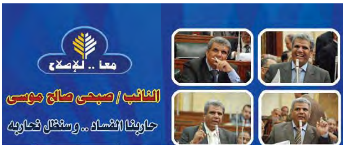
מתוך האתר, של חבר הפרלמנט לשעבר צבחי צאלח ( http://www.sobhisaleh.com ).

41. עו"ד, בן 58, חבר תנועת האחים המוסלמים במצרים. צבחי צאלח היה ציר בפרלמנט המצרי בין השנים 2005-2010. ובמקביל שימש חבר ודובר של PRC 81 . צבחי צאלח הינו עורך דין, יליד 1953, מתמחה במשפט מצרי, אשר כיהן עד לאחרונה כחבר פרלמנט מטעם האחים המוסלמים (2005-2010). מ-2004 ועד היום הינו חבר במועצת התאחדות עורכי הדין במצרים. באתר האינטרנט שלו מציין במפורש, כי הוא משמש כחבר שלא מן המניין (עצו מראסל) ב-PRC בלונדון.