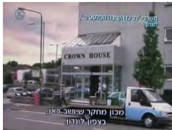
משרדי PRC בצפון לונדון (מתוך תוכנית "המקור", ערוץ 10, 25 באוגוסט 2010)

The Palestinian Return Centre (PRC) 100h Crown House North Circular Road London NW10 7PN The United Kingdom Tel. No.: 00 44 (0) 2084530919 Fax: 00 44 (0) 2084530994 Email: info@prc.org.uk