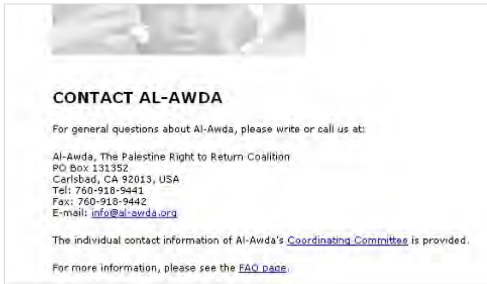
דרכי הקשר עם ארגון אלעודה בארה"ב (מתוך אתר אלעודה)