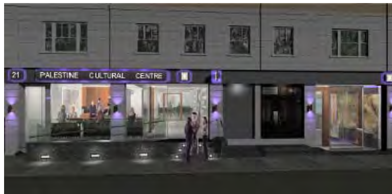
"המרכז התרבותי הפלסטיני" הנמצא מול הספרייה הבריטית בלונדון