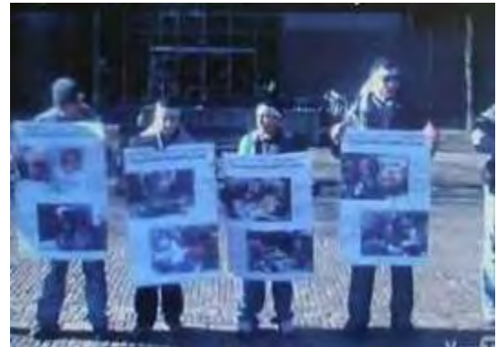
הפגנה בלונדון שארגן PRC בעקבות מבצע "עופרת יצוקה". במהלכה הניפו המפגינים תמונות גופות ילדים פלסטינים.