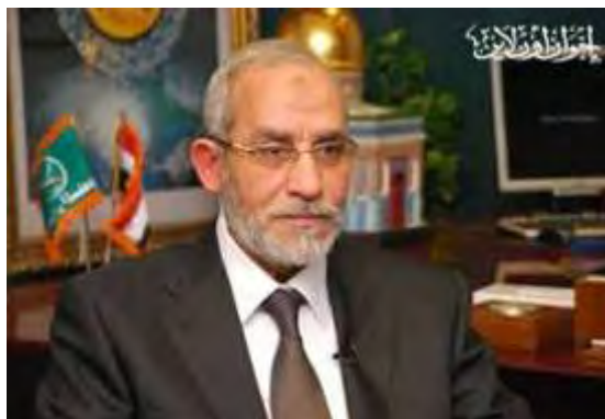
מחמד בדיע, המדריך הכללי הנוכחי של האחים המוסלמים במצרים, שדבריו מתפרסמים גם בביטאון האחים המוסלמים בלונדון. מחמד בדיע מרבה בקריאות לשליטים המוסלמים לדבוק בדרך הג'האד וקורא למצרים לבטל את הסכמי קמפ דייוויד. 116

ג. איגרתו השבועית של מחמד בדיע , המדריך הכללי הנוכחי של האחים המוסלמים במצרים, עוסקת בקרב בדר, שבו ניצחו ראשוני המוסלמים המעטים את תושבי מכה הרבים מהם (גיליון 652, 24 ביולי 2010). בדיע מעלה את השאלה: האם נוכל להיות כמותם? שהרי הם היו מעטים שהג'האד נכפה עליהם, אך ניצחו לבסוף. הם החליטו, כשהם חדורי אמונה, להיאבק בג'האד למרות מיעוטם המספרי . בדיע מציין כי התפילה לאללה והכיסופים/התשוקה להגיע לגן העדן היוו את הכוח המניע לניצחון המוסלמים בקרב בדר. בדיע ממשיך ומציין, כי "האחים לאמונה [באסלאם] קוראים לנו בכל מקום שבו מוסלמים נרדפים. אנו רואים אותם בפלסטין, עיראק, סומליה, אפגניסטאן ומקומות נוספים, שם תקפו אותם האויבים וחבריהם הסגירו אותם להם [לאויבים]. אם אנו אנשי בדר, המאמינים באללה, האם לא נצא לעזרתם??" .