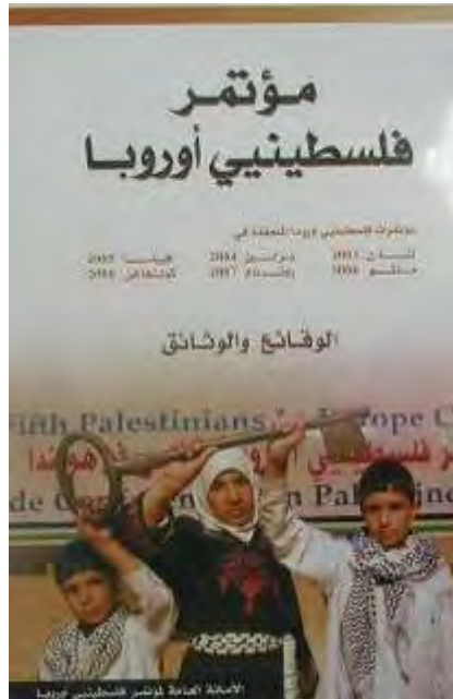
עמוד השער של הספר המסכם את כינוסי ועידות הפלסטינים של אירופה בין השנים 2003-2008. האישה ושני הילדים אוחזים במפתח המסמל את "זכות שיבה"

6. צוהר לנעשה בוועידות אלו ניתן למצוא בספר בשפה הערבית בשם "ועידת הפלסטינים של אירופה" . הספר יצא לאור בשנת 2008 ע"י PRC בשיתוף עם "המזכירות הכללית של ועידת הפלסטינים של אירופה" והוא מסכם את הוועידות בשנים 2003-2008. מידע חלקי על הוועידות (ברמת פרוט נמוכה מזו שבספר) ניתן למצוא גם בשפה האנגלית, לרוב באתר האינטרנט של PRC. נספח זה מפרט את עיקרי התכנים של הוועידות באירופה, בתוספת מידע שבידינו אודות שתי הוועידות בשנים 2009 ו-2010 (שאינן מוזכרות בספר).