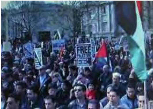
מתוך הפגנה שארגן PRC בלונדון בעקבות מבצע "עופרת יצוקה"

ט. פעילות מדינית-תעמולתית מול הדרג הפוליטי בבריטניה ומול הפרלמנט האירופי: בינואר 2009 קיים PRC סמינר בפרלמנט הבריטי בנושא המצב ברצועת עזה. בסמינר השתתפו מספר חברי פרלמנט, לרבות כמה חברים ממפלגת הלייבור, שעמדתם ביקורתית כלפי מדינת ישראל 31 . ב-28 בינואר 2009, לאחר מבצע "עופרת יצוקה", ארגון PRC משמרת מחאה נגד ה"מצור" על רצועת עזה . משמרות המחאה התקיימה ברחוב דאונינג 10, מעונו הרשמי של ראש ממשלת בריטניה דאז (גורדון בראון) והשתתפו בה גופים עמיתים כגון "הפורום הפלסטיני בבריטניה". ב-29 בינואר 2009 משלחת של PRC, עם כמה ארגונים עמיתים, נועדה בבריטל עם סגנית נשיאת הפרלמנט האירופי לואיסה מורגאטיני, שמסרה, כי היא עומדת לבקר ברצועת עזה במסגרת משלחת של הפרלמנט האירופי.