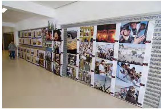
מתוך תערוכת הצילומים של PRC במסגרת הכנס האירופאי השישי, שנערך בקופנהגן (2008).

21. מלבד הגלריה שבמרכז התרבותי בלונדון, מארגן PRC תערוכות צילומים כאמצעי נוסף להפצת התעמולה האנטי-ישראלית, שבמרכזה הברוטאליות הישראלית וסבלם של הפלסטינים.