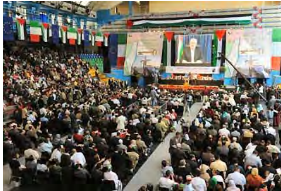
אסמאעיל הניה, ראש ממשל חמאס, נואם בפני באי הועידה השביעית