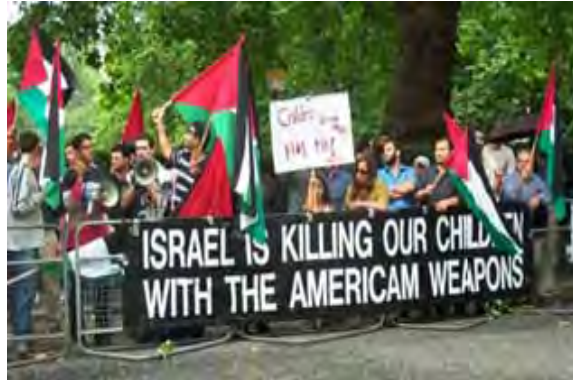
מתוך הפגנה שארגן PRC בסמוך לשגרירות ארצות-הברית בלונדון (אתר PRC)

legally guaranteed by all international laws and this right is natural, non-negotiable and inalienable 32 .