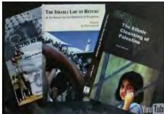
ספרים שהוציא לאור PRC. הראשון מימין נקרא "הטיהור האתני בפלסטין"