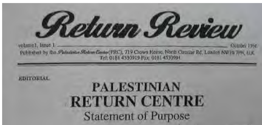
כותרת המהדורה הראשונה של Return Review היוצא לאור ע"י PRC בלונדון, אוקטובר 1996

16. PRC מפרסם ירחון בשפה הערבית בשם אלעודה (השיבה) וירחון מקביל בשפה האנגלית בשם Return Review 41 . שניהם מופצים למנויים שונים, יחידים ומוסדות, בבריטניה, אירופה וברחבי העולם. לטענת PRC, קיים גידול קבוע במספר המנויים לירחונים הללו 42 (דוגמאות לתכני הירחונים ראו נספח ה'). בנוסף לכך מפרסם PRC ניירות עמדה (papers) המוצגים בסמינריונים ובהרצאות ועלוני חדשות (newsletters).