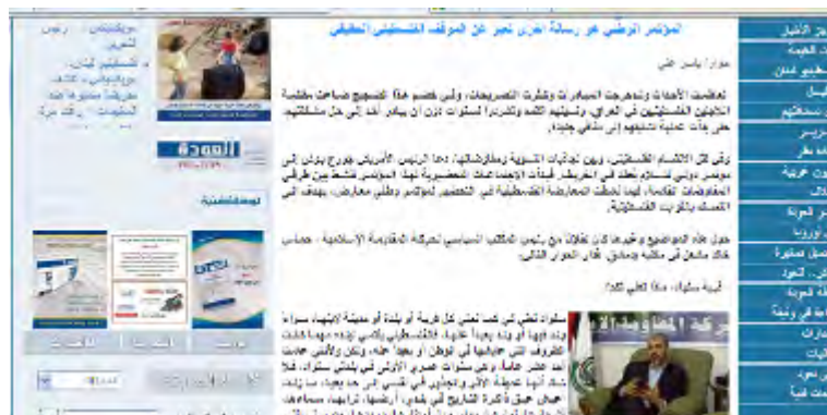
נוסח הראיון עם ח'אלד משעל במהדורת נובמבר 2007 של "אלעודה"

2. במהדורות הירחון בערבית ובאנגלית מופיעים מוטיבים בהם נעשה שימוש בתעמולה האנטי-ישראלית של PRC : אי הכרה בלגיטימיות של קיום ישראל; "אחריותה" של ישראל להיווצרות בעיית הפליטים; "זכותם" של הפליטים לשוב למקומות מגוריהם; הכפשה של הפלסטינים, קורבן ל"ברוטליות" הישראלית מאז 1948; היותה של ישראל "מדינה גזענית" המבצעת "טיהור אתני ומעשי טבח"; הצגת הציונות כתנועה גזענית בלתי לגיטימית, ועוד. בנוסח הערבי של אלעודה מופיע שמה של ישראל במירכאות כביטוי לחוסר ההכרה בה, וישובים ישראלים בתחומי "הקו הירוק" מכונים "התנחלויות" (מסתעמראת), כביטוי לחוסר הלגיטימיות שלהם. הירחון מפרסם ראיונות עם ראשי חמאס כגון ראיון עם השיח' יאסין (אפריל 2004) ועם ראש הלשכה המדינית ח'אלד משעל (נובמבר 2007).