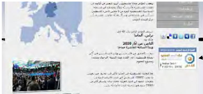
מימין: קישורית לערוץ אלקדס, ערוץ הלוויין של חמאס (מתוך אתר הוועידה של הפלסטינים של אירופה, 2010).