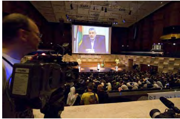
ראש ממשל חמאס ברצועה אסמאעיל הניה נואם באמצעות מסך וידאו בוועידה האירופית החמישית בהולנד (2007)