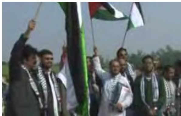
השיירה יוצאת לדרכה (PresstV, איראן, 2 בדצמבר 2010)

■ "צי החירות 2" : על פי דיווח בתקשורת הערבית המשט המשודרג שמארגנת הקואליציה האנטי-ישראלית, המכונה "צי החירות 2" צפוי לצאת בחודש אפריל 2011. ישתתפו בו 34 כלי שיט (אלקדס, 2 בדצמבר 2010).