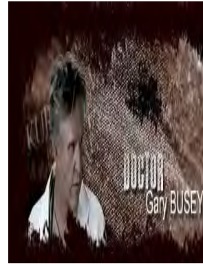
תמונה מהסרט "עמק הזאבים - עיראק" (אתר הסרט באינטרנט). השחקן האמריקני גרי בוסו מגלם את דמותו של רופא יהודי רודף בצע הסוחר בכליות חללי מלחמה עיראקים.

13.ב- 2007 עלתה לשידור עונה חדשה של הסדרה בשם "עמק הזאבים - מלכודת", שהקרנתה עדיין נמשכת. בינואר 2010 הציגה הסדרה את אנשי המוסד ונציגי ישראל בתורכיה כחוטפי תינוקות תורכיים על מנת להמיר את דתם. בסדרה נראו כוחות הביטחון התורכיים פולשים אל השגרירות הישראלית, ולאחר קרב קשה מצילים ילד תורכי חטוף. בסצנת הסיום הדרמתית מצמיד השגריר הישראלי אקדח לראשה של מטפלת תורכיה, האוחזת בילד מפוחד, ומאיים לירות בה. הקצין הטורקי אינו ממצמץ ויורה בשגריר כדור בין העיניים. דמו של השגריר ניתז על דגל ישראל התלוי ברקע 8 .