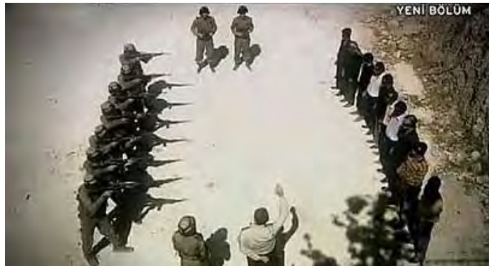
מתוך הסדרה "הפרדה": פלסטינים תמימים מול כיתת יורים של חיילים ישראלים

פיצוצים, ילדים שמשליכים אבנים והרוגים המוטלים מכל עבר, נראית גם תמונה שבה שורה של פלסטינים עומדת בפני כיתת יורים. 10