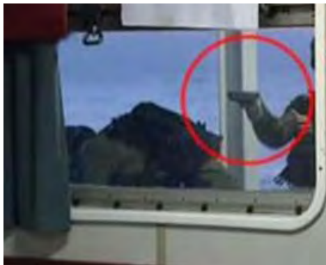
תמונה מתוך הקדמון: חייל ישראלי מכוון אקדח לעבר הנוסעים על גבי ה"מרמרה"

8. עלילת הסרט עוסקת בסוכן תורכי, היוצא לנקום בגנרל ישראל אכזר בשם משה בן אליעזר, אשר תכנן וביצע את ההתקפה על ה"מרמרה" (את דמותו מגלם שחקן תורכי עם רטייה על עינו, המעוררת אסוציאציה למשה דין). בפתח הקדימון לסרט דורש מפקד ישראלי מהספינה "מרמרה" לעצור ומשזו מסרבת, עולים חיילי צה"ל על סיפונה ותוקפים את הנוסעים המנסים להגן על עצמם. בהמשך, הסוכן התורכי וחבריו נשלחים ל"פלסטיין" על מנת לנקום במפקד הישראלי. בסרט נראות דמויות המייצגות את חיילי צה"ל יורים בעצורים פלסטינים כפותי ידיים . בסופו של הסרט, אכזריותו של הגנרל הישראלי והאמצעים הטכנולוגיים המגוונים העומדים לרשותו, לא הצילו אותו מידי הנוקמים התורכיים. 5