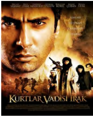
פוסטר לקידום הסרט "עמק הזאבים - עיראק".