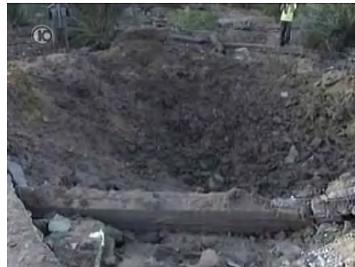
שניים מיעדי הטרור לאחר שהותקפו על ידי חיל האוויר (19 בנובמבר 2010)