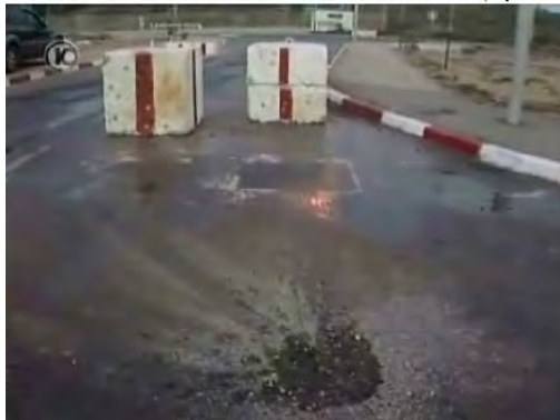
אזור נפילת פצצת המרגמה סמוך לבסיס זיקים

■ שגריר ישראל באו"ם הגיש מחאה רשמית למזכ"ל האו"ם על ירי הרקטות והשימוש בפצצות המכילות זרחן. מנגד, דובר ממשל חמאס הכחיש כי נעשה שימוש בזרחן (אתר משרד החוץ, 19 בנובמבר 2010; טלוויזיית אלקדס, 20 בנובמבר 2010).