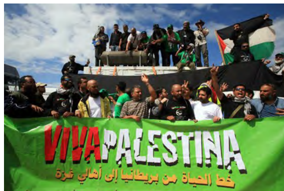
פעילי שיירת ארגון ויוה פלסטינה בלאד'קיה. הכתובת בערבית "קו החיים מבריטניה לתושבי עזה"