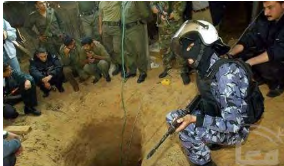
איש כוחות הביטחון המצרים ליד פתח מנהרה (מען, 19 באוקטובר 2010)

■ בכלי התקשורת הפלסטינים והמצריים דווח כי ב-18 באוקטובר תפסו כוחות הביטחון המצרים משלוח אמצעי לחימה שיועד להברחה מסיני לרצועת עזה באמצעות המנהרות. המשלוח כלל כ-150 קילוגרם חומר נפץ, אפודי מגן, 33 מוקשים, 55 רובים אוטומטיים, תחמושת ו-25 רימוני יד. כמו כן חשפו כוחות הביטחון המצרים חמש מנהרות להברחת סחורות ומכוניות לרצועת עזה. באחת המנהרות נתפסו כמויות גדולות של סחורות ומכשירי חשמל (אלקדס, 18 באוקטובר 2010; מצראוי, 18 באוקטובר 2010; מען, 18 באוקטובר 2010).