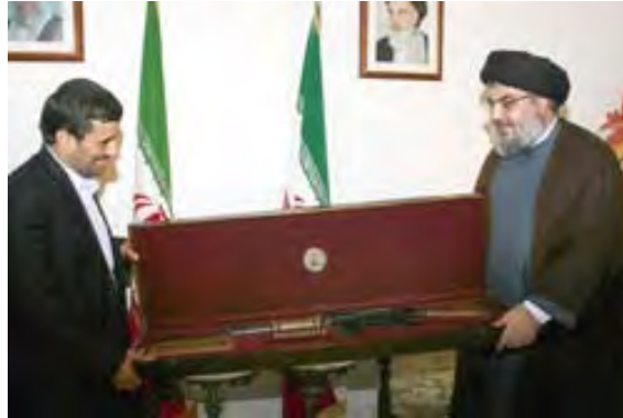
נצראללה מעניק לאחמדינג'אד רובה שלטענת חזבאללה נלקח שלל מידי צה"ל במהלך מלחמת לבנון השנייה, במהלך פגישתם ב-14 באוקטובר (dailystar.com.lb), 16 באוקטובר (2010)

■ ביומו השני של הביקור ביקר אחמדינג'אד בדרום לבנון, בין השאר בעיירה בינת ג'יבל. בנאומו שם שיבח את "ההתנגדות הלבנונית" (קרי, חזבאללה). הוא טען כי "לציונים אין דרך מלבד להיכנע לאומות האזור ולחזור לביתם המקורי", קרי - לעזוב את מדינת ישראל (סוכנות הידיעות פארס, 14 באוקטובר 2010). באותו היום נפגש אחמדינג'אד עם מזכ"ל חזבאללה נצראללה ושב לאיראן (אלמנאר, 14 באוקטובר 2010).