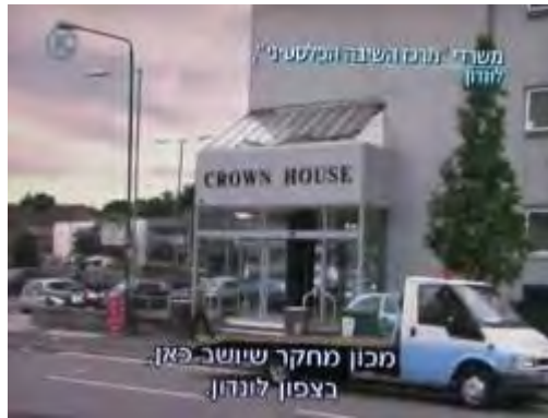
בבניין בלונדון שבו נמצאים משרדי מרכז השיבה הפלסטיני (PRC) ארגון המזוהה עם חמאס והאחים המוסלמים, ממוקמים גם משרדי ECESG (מתוך תוכנית "המקור", באדיבות ערוץ 10, 25 באוגוסט 2010)