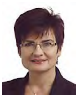
קטרין זקס (www.europal.ee)

23. קטרין זקס (Katrin Saks) - ילידת 1956, טאלין אסטוניה. סגן יו"ר המפלגה הסוציאל-דמוקרטית באסטוניה . נבחרה בפרלמנט האירופאי ב-2006. הפסידה את מושבה ב-2009.