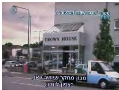
מימין: המבנה בו נמצאים משרדי PRC בלונדון. הבניין משמש גם את מסגרת העל ECESG. משמאל: דלת משרד PRC בלונדון (מתוך תוכנית "המקור", באדיבות ערוץ 10, 25 באוגוסט 2010)

5. PRC מקיים פעילות מדינית-תעמולתית רבה מול בכירי הדרג הפוליטי בבריטניה, במטרה להגביר מודעותם ל"סבלם של הפליטים הפלסטינים" (כשהמטרה הסמויה, הבלתי מוצהרת, היא להערים קשיים בפני סיכויי כל הידברות מדינית בין ישראל לרשות הפלסטינית, ברוח עמדת חמאס). לשם כך פועל PRC כשדולה בקרב חברי פרלמנט ומספק להם "מידע" על סוגיות הקשורות במישרין או בעקיפין לנושא הפלסטיני באמצעות ארגון סדנאות וסמינרים. PRC גם מזמין חברי פרלמנט להשתתף בפעילויותיו, מספק להם את פרסומיו ומצייד אותם ב"מידע מעודכן".