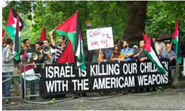
הפגנה של ארגון מרכז השיבה הפלסטיני סמוך לשגרירות ארה"ב בלונדון (אין תאריך)