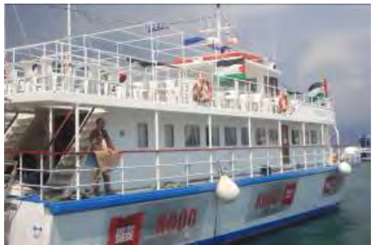
הספינה Sfendoni ("8,000"), שהשתתפה במשט האחרון מטעם ECESG. 8,000 הינו מספר הפלסטינים העצורים בידי ישראל בגין פעולות טרור.