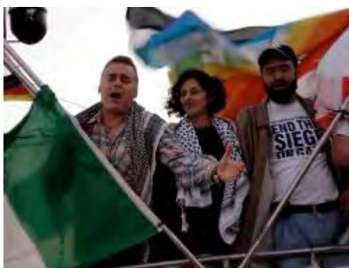
פעיל ECESG (מימין) על גבי הספינה Dignity (אתר FGM)

ד. שיגור הספינה Spirit of Humanity (יוני 2009). אונייה זאת ניסתה להגיע לחופי עזה ועליה מטען של תרופות וכ-40 רופאים, עיתונאים, אנשי פרלמנט ופעילי זכויות אדם. היא נעצרה ע"י חיל הים הישראלי בקרבת נמל עזה (ג'רוזלם פוסט, 29 ביוני 2009).