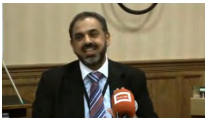
לורד נזיר אחמד (YouTube 14 בדצמבר 2009)

3. לורד נזיר אחמד ברון רוטרהאם : יליד 1958, מוצאו מפקיסטן. נשוי ואב לשלושה ילדים. חבר בבית הלורדים הבריטי החל מ-1998, אחד משני הצירים המוסלמים היחידים בו והמוסלמי הראשון שקיבל תואר לורד. פעילותו הפוליטית קשורה ברובה לקהילה המוסלמית בבריטניה ומחוצה לה. אישיותו שנויה במחלוקת. היה חבר במפלגת הלייבור עד שגורש ממנה בפברואר 2009 לאחר שנשפט על נהיגה מסוכנת. ביקר את התקיפה האמריקנית-בריטית באפגניסטן בעקבות הפיגוע במגדלי התאומים, אם כי לרוב פועל להרגעת המתחים בין האסלאם והמערב.