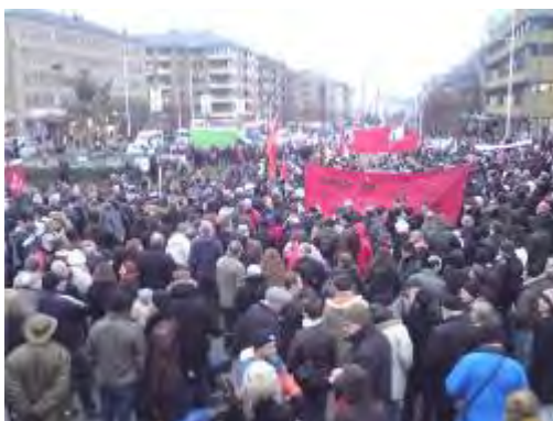
הפגנת מחאה אנטי-ישראלית שהארגון כינס בינואר 2009 (www.palestine.se)

28. ארגון אנטי-ישראלי שהוקם בשנת 2004 במטרה מוצהרת לעודד תמיכה עממית בעם הפלסטיני ו"להקל על סבלו". הארגון מארגן אירועים שונים בשבדיה כולל עצרות, כינוסים, יריד ספרים, הפגנות ועוד. הארגון משתף פעולה עם ארגונים דומים בשבדיה ובכלל זה הפדרציה האסלאמית של שבדיה.