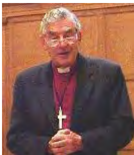
לורד ריצ'ארד האריס

28. לואיזה מורגנטיני (Luisa Morgantini) – נולדה ב-1940. נציגה בפרלמנט האירופאי מטעם איטליה. נבחרה כעצמאית בתוך המפלגה הקומוניסטית. חברה מובילה בתנועת השלום האיטלקית ואחת המייסדות של ארגון נשים בשחור. ביוני 2008 נפצעה בעת הפגנה בבלעין (news.bbc.co.uk, 6 ביוני 2008).