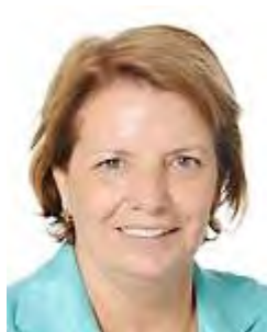
אילדה פיגורידו

25. אילדה פיגורידו (Ilda Figueiredo) – ילידת 1948, פורטוגל. חברה בפרלמנט האירופאי מטעם המפלגה הקומוניסטית הפורטוגזית. היא גם חברה ב-Confederal Group of the European United Left.