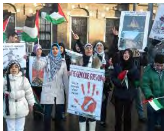
הפגנה פרו-חמאסית של PPMS מאשימה את ישראל בג'נוסייד (אתר ppms.nl )