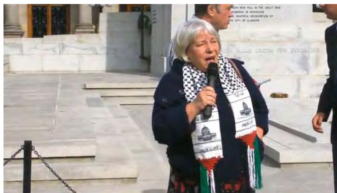
סנדרה וייט מגנה את פעולת ישראל נגד המשט לעזה (מאי 2010)

7. סנדרה ווייט (Sandra White): ילידת 1951, חברת הפרלמנט הסקוטי המייצגת את מחוז גלאזגו, מטעם מפלגת הלייבור. חברת הוועידה הבין-מפלגתית של הפרלמנט הסקוטי לענייני פלסטין, חברת הוועדה הבין מפלגתית של הפרלמנט הסקוטי לענייני מבקשי מקלט ופליטים ובוועדות פרלמנטאריות נוספות. בנובמבר 2008 ביקרה ברצועת עזה במסגרת "וועדת בדיקה". הנסיעה מומנה בידי ECESG. במרץ 2009 ביקרה בסוריה ונפגשה עם הנשיא אסד במסגרת משלחת של חברי פרלמנט, שמומנה בידי ECESG.