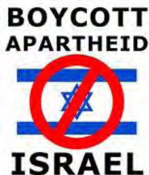
קריאה להחרמת ישראל באתר הארגון