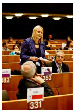
נריס אוואנס ( http://www.nerysevans.org/photo-gallery?ngqpage=2 )

12. נריס אוואנס (Nerys Evans) – ילידת 1980, וויילס. חברת האסיפה הלאומית של וויילס מטעם מחוז Plaid Cymru. משמשת גם כדוברת המפלגה.