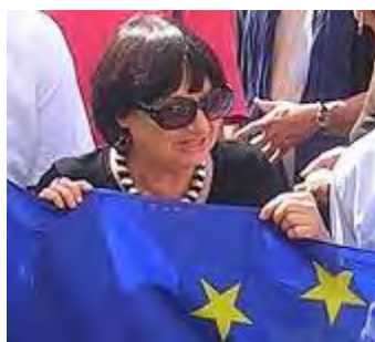
לואיזה מורגנטיני (ויקיפדיה)

28. לואיזה מורגנטיני (Luisa Morgantini) – נולדה ב-1940. נציגה בפרלמנט האירופאי מטעם איטליה. נבחרה כעצמאית בתוך המפלגה הקומוניסטית. חברה מובילה בתנועת השלום האיטלקית ואחת המייסדות של ארגון נשים בשחור. ביוני 2008 נפצעה בעת הפגנה בבלעין (news.bbc.co.uk, 6 ביוני 2008).