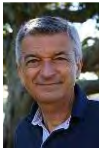
סטפאנו מונטנארי

18. סטפאנו מונטנארי (Stefano Montanari) – יליד 1949 בבולניה איטליה. רוקח במקצועו חוקר תרופות. פרסם מחקרים, ספרים ופטנטים בתחום זה.