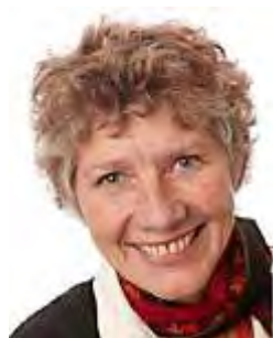
מרגרט אוקון

25. אילדה פיגורידו (Ilda Figueiredo) – ילידת 1948, פורטוגל. חברה בפרלמנט האירופאי מטעם המפלגה הקומוניסטית הפורטוגזית. היא גם חברה ב-Confederal Group of the European United Left.