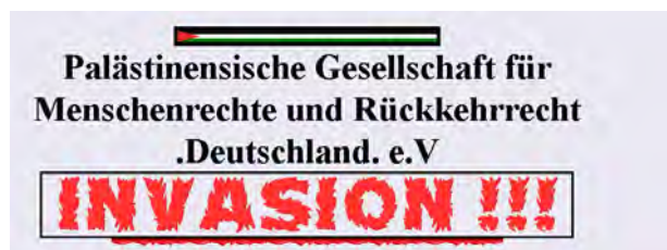
דף הבית של אתר האינטרנט של הארגון

25. אפשר והמדובר בארגון Palästinensische Gesellschaft für Menschenrechte und Rückkehrrecht Deutschland. על פי אתר האינטרנט של הארגון המדובר בארגון קיקיוני המקיים פעילות תעמולתית נגד ישראל. באתר מוצג לוגו נוטף דם ותמונות של גופות של פלסטינים תוך האשמות של ישראל בטבח אזרחים ובאפרטהייד ( http://pgmmenschenrechte.jeeran.com/palestine.html ).