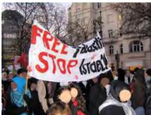
הפגנה אנטי-ישראלית של הארגון בדצמבר 2008

22. על פי אתר הארגון, הוא הוקם בשנת 1996, לאחר חתימת הסכמי אוסלו, לשם הגשת סיוע כלכלי וקיום פעילות תרבותית בקרב הקהילה הפלסטינית בגרמניה, המונה 70,000-100,000 איש. החברים בארגון משלמים תשלום חודשי.