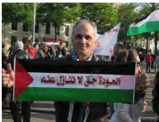
מפגין בהפגנה של ארגון PPMS מחזיק שלט המדגיש את "זכות השיבה" של הפליטים הפלסטינים לישראל