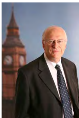
בריאן אידון

5. ד"ר בריאן אידון (Brian Iddon): יליד 1940, ד"ר לכימיה. חבר הפרלמנט הבריטי מטעם מפלגת הלייבור משנת 1997 פרש מתפקידו בשנת 2006. שימש כמזכיר הקבוצה הבריטית-פלסטינית בפרלמנט ( http://en.wikipedia.org/wiki/Brian_Iddon ).