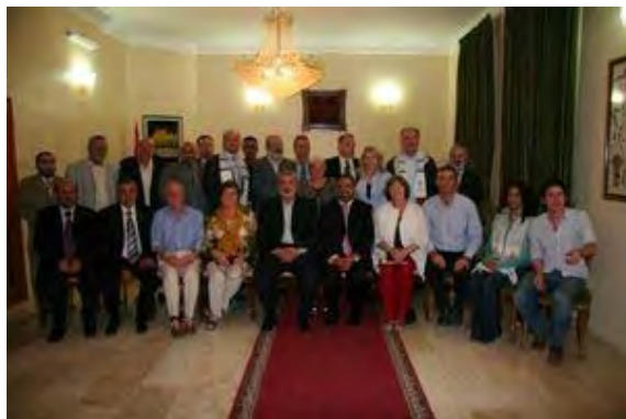
המשלחת הפרלמנטאריה לעזה משנת 2008 בפגישה עם אסמאעיל הניה 13 http://www.chrisandrews.ie/content.php4?area=146&item=829 , (בספטמבר 2010)