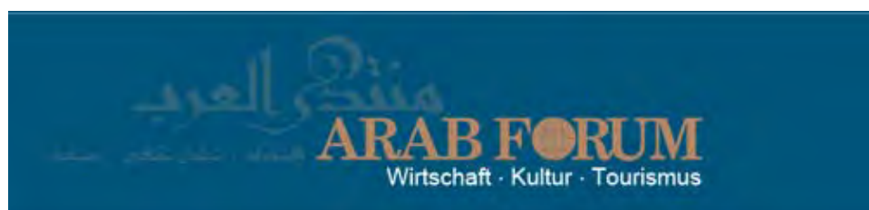
לוגו של הארגון