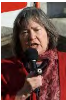
Clare Short (ויקיפדיה)

1. Clare Short - חברת פרלמנט בריטית. כיהנה כשרה בממשלת טוני בלייר. חברת מפלגת הלייבור. הפליגה לרצועה על גבי הספינה Dignity יחד עם 24 פעילים בנובמבר 2008. מייצגת את ה-ECESG בפגישות עם מנהיגים. עמדה בראש משלחת של פרלמנטרים אירופים, שנועדה עם הנשיא אסד (אתר הארגון, 8 באוגוסט 2009). משתתפת פעילה גם בכינוסים ואירועים של מרכז השיבה הפלסטיני (PRC).