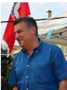
ג'וזף זיסיאדיס (ויקיפדיה)

22. ג'וזף זיסיאדיס (Josef Zisyadis) – נולד ב- 1956 באיסטנבול. חי בשוויץ, חבר במועצה הלאומית השוויצרית מטעם מפלגת הלייבור השוויצרית . חבר ב-FGM. השתתף במשט האחרון לרצועת עזה כחלק מקבוצה של פרלמנטרים אירופאים. איים כי אם ישראל לא תתיר את כניסת המשט יפנה לבית הדין האירופאי.