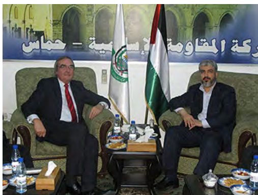
רוג'ר גודסיף בפגישה עם ח'אלד משעל במאי 2009