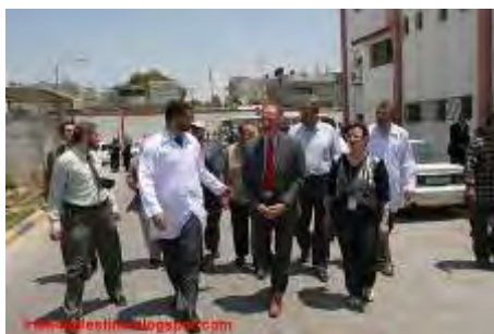
פרדיננדו רוסי מבקר ברצועת עזה

באיגודי פועלים ולאחרונה הקים מפלגה משלו. ביקר ברצועת עזה פעמיים ב-2008 וב-2009. השתתף במשט האחרון לרצועת עזה הגיע ללרנקה.