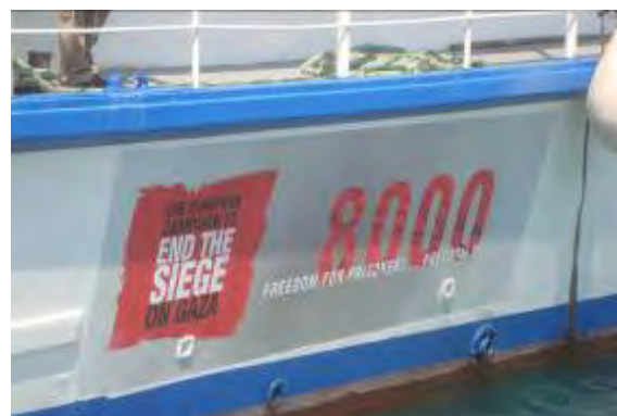
הספינה "8,000" שהשתתפה במשט מטעם ECESG