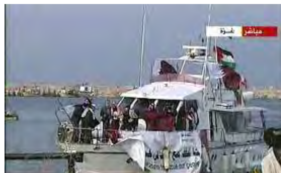
הגעת הספינה Dignity לנמל עזה (אלג'זירה, 20 בדצמבר 2008)