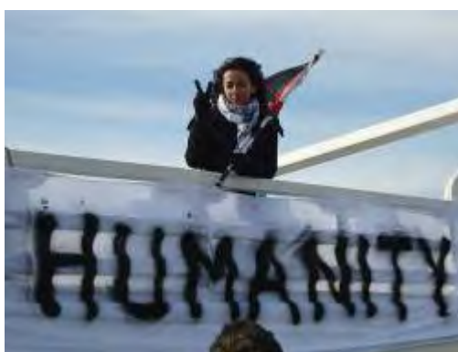
הספינה Spirit of Humanity

ד. שיגור הספינה Spirit of Humanity (יוני 2009). אונייה זאת ניסתה להגיע לחופי עזה ועליה מטען של תרופות וכ-40 רופאים, עיתונאים, אנשי פרלמנט ופעילי זכויות אדם. היא נעצרה ע"י חיל הים הישראלי בקרבת נמל עזה (ג'רוזלם פוסט, 29 ביוני 2009).