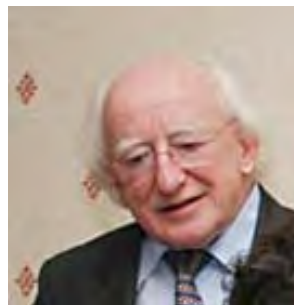
מיכאל ד. היגנס

16. מיכאל ד. היגנס (Michael D Higgins) – יליד 1941 אירלנד. חבר במפלגת הלייבור האירית. נשיא המפלגה והדובר לענייני חוץ. שר האומנויות והתרבות לשעבר.