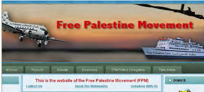
לוגו Free Palestine Movement באתר האינטרנט שלו (Free Palestine, 22 באוגוסט 2010)

1. Free Palestine Movement הינו ארגון המגדיר עצמו כארגון זכויות אדם ללא כוונות רווח, שבסיסו בקליפורניה , ארצות הברית. לארגון מספר קבוצות ברחבי ארצות הברית. הוא טוען, כי משימתו היא לאתגר את המדיניות הישראלית, השוללת את זכויות האדם של הפלסטינים בדגש על חופש התנועה. זאת הוא מנסה להשיג, לטענתו באמצעות "התנגדות לא-אלימה". הארגון וארגונים נוספים מסוגו מרבים להציג עצמם כבלתי אלימים, אולם בפועל הם נכונים להפעיל אלימות קשה נגד כוחות הביטחון הישראליים.