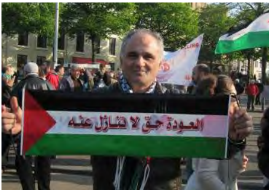
מפגין בהפגנה של ארגון PPMS מחזיק שלט המדגיש את "זכות השיבה" של הפליטים הפלסטינים לישראל (ppms.nl)