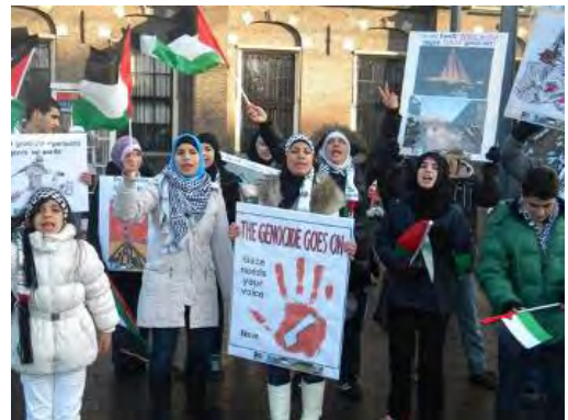
הפגנה פרו-חמאסית למען עזה מאשימה את ישראל בג'נוסייד