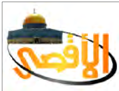
ערוץ אלאקצא חזר לשדר

ערוץ אלאקצא של חמאס עקף את האיסור הצרפתי על שידוריו באמצעות הסכם עם חברת לוויני התקשורת Golsat מכווית; אולם, גם חברה זאת עושה שימוש בלוויני תקשורת של חברת Eutelsat הצרפתית, שהונחתה ע"י ממשלת צרפת להפסיק את שידורי ההסתה של ערוץ אלאקצא 1