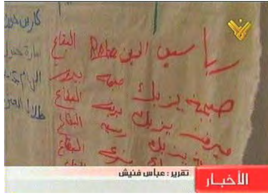
רשימת הנוסעות בספינה מרים שהוצגה לתקשורת (אלמנאר, 20 ביוני, 2010)

6. משרד התחבורה הלבנוני הערים בתחילה קשיים על מארגני הספינות אולם ביממה האחרונה דווח, כי נפתרו מרבית הבעיות. למרות הצהרות המארגנים כי הספינות מוכנות לצאת לדרכן, לא נראה כי הציוד הועמס על גבי הספינות. דווח כי שתי ספינות אמורות לצאת מלבנון לקפריסין ומשם לרצועת עזה . הספינות ככל הנראה לא תשאנה דגלים לבנוניים. לפי שעה לא ברור מתי תצאנה הספינות והאם תצאנה יחד, כמשט אחד, או כל אחת לחוד.