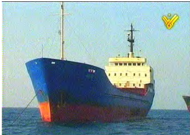
הספינה Julia ( ששמה הוסב לנאג'י אלעלי ) ( אלמנאר, 20 ביוני, 2010 )