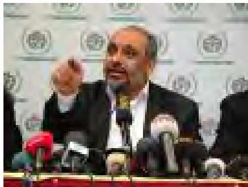
ראש הארגון IHH בולנט ילדרים 7 באפריל 2010 www.ihh.org.tr

1. בקרב הקואליציה הנוטלת חלק במשט הסיוע העומד להגיע בימים הקרובים לרצועת עזה, בולט ארגון IHH התורכי : בשמו המלא - Insani Yardim Vakfi (IHH) (קרן הסיוע ההומניטארי). מדובר בארגון בעל אוריינטציה אסלאמית-רדיקלית אשר הוקם בשנת 1992 ובשנת 1995 נרשם פורמלית באיסטנבול. בראשו עומד בולנט ילדרים .