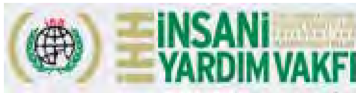
הלוגו של ארגון IHH (יונת השלום מופיעה בלוגו שלו משמאל)

3. בפועל, לצד פעילותו ההומניטרית הלגיטימית, מסייע ארגון IHH לארגוני טרור בעלי אופי אסלאמי-רדיקלי, כשבשנים האחרונות בולט הסיוע שהארגון מגיש לחמאס (במסגרת "קואליציית הצדקה"). בידינו מידע מהימן, כי הארגון העניק בעבר סיוע לוגיסטי ומימון כספי גם לגורמי ג'האד עולמי.