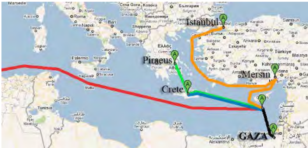
מסלול המשט - המסלול האדום הינו של הספינה המגיעה מאירלנד - (אתר IHH)

22. במסגרת זאת רכש ארגון IHH עבור משט הסיוע שלוש ספינות מתוך כתשע המשתתפות בו: ספינת נוסעים בשם Mavi Marmaris ושתי ספינות משא (אחת מהם בשם עזה). ספינת הנוסעים יצאה מנמל איסטנבול ב-22 במאי אל נמל אנטליה, שם צפויים עלו על סיפונה כ-500 נוסעים. מנמל אנטליה יצאו שלוש הספינות התורכיות לקפריסין על מנת לחבור לשאר ספינות המשט ומשם להפליג לרצועה (אליה צפויים להגיע ככל הנראה בבוקר 29 במאי). בנוסף לכך סייע IHH למשרד התחבורה ומשרד העבודות הציבוריות בממשל חמאס בביצוע עבודות בחודשים האחרונים בנמל עזה לשם הכשרתו לקליטת ספינות המשט (פלסטין אליום, 19 באפריל, 2010).