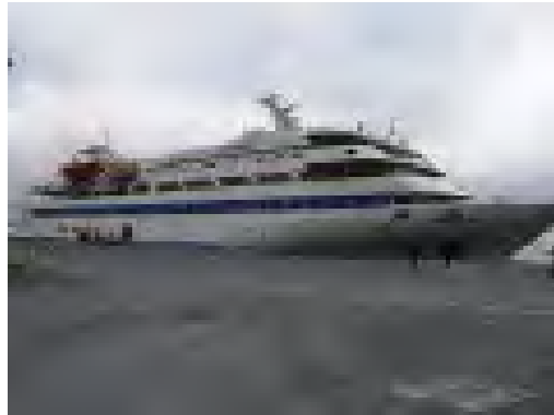
ספינת הנוסעים Mavi Marmaris שנרכשה עבור המשט ( www.ihh.org.tr 7 באפריל 2010)

ה. נוסעי הספינות יעזבו את איסטנבול וישוטו לעזה במים הבינלאומיים הם יעצרו בנמלי אנטליה, קירינאה ופמגוסטה . חלק מהמטען יועמס באיסטנבול וחלק בנמל מרסין . המסע יארך בין 10-15 ימים תלוי בתנאי מזג האוויר ותגובת ישראל.