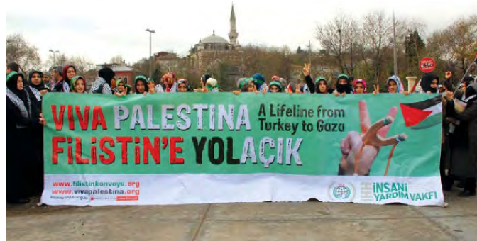
פעילות קודמת של ארגון IHH בדצמבר 2009 (אתר הארגון www.insaniyardim.ihh.org.tr 7 באפריל, 2010).

3. יוזכר כי ל-IHH מעורבות קודמת בשיגור סיוע לממשל חמאס ברצועה . ב-9 בדצמבר יצאה שיירת סיוע מאירופה לרצועה, בדרך היבשה ובדרכה חצתה את תורכיה. ה-IHH תרם לשיירה 80 כלי רכב על מנת שיובילו סיוע דרך סוריה, ירדן ומצרים לרצועה (המקור: www.insaniyardim.ihh.org.tr , להלן אתר ה-IHH).