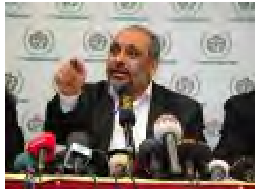
ראש הארגון ה-IHH בולנט ילדרים 7 באפריל 2010 www.ihh.org.tr