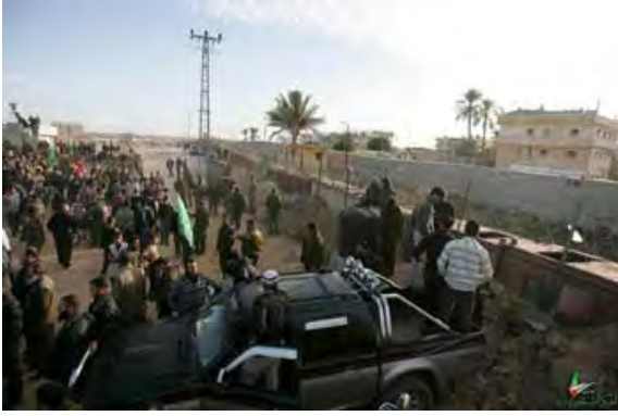
הפגנת מחאה של תושבי רצועת עזה ברפיח (Palestine-info, 22 בדצמבר)