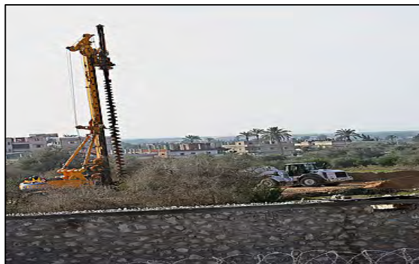
עבודות חפירה מצריות לצורך בניית חומת הפלדה ברפיח (פלסטין, 18 בדצמבר, 2009)