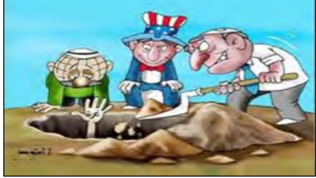
קריקטורה המבקרת את שיתוף הפעולה בין מצרים, ישראל וארה"ב בסגר על הרצועה על רקע החומה שמצרים בונה. (אלרסאלה, 21 דצמבר).

■ בכמה עיתונים מצריים הדגישו מאמרי מערכת את הסכנה הנשקפת למצרים בעקבות ההברחות באמצעות המנהרות ואת זכותה של מצרים להגן על ריבונותה ועל ביטחונה . כמו כן נמתחת ביקורת על חמאס ועל האשמותיה כי מצרים נטלת חלק ב"מצור" על רצועת עזה (רוז אליוסף, אלאהראם, 21 בדצמבר).