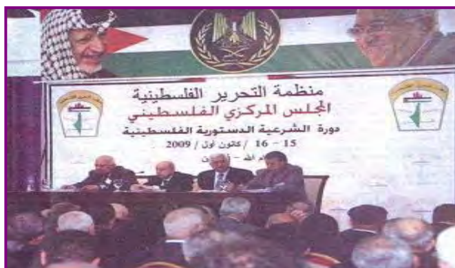
כינוס המועצה המרכזית של אש"ף (אלקדס, 16 דצמבר, 2009)