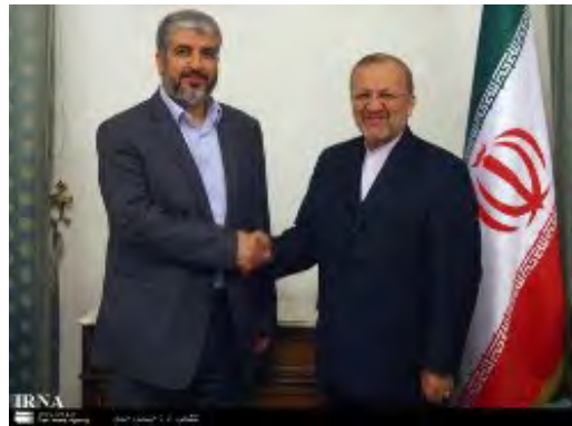
יו"ר הלשכה המדינית של חמאס ח'אלד משעל בפגישה עם שר החוץ של איראן מנושה'ר מתכי (איראן, 14 בדצמבר, 2009)

■ משלחת של תנועת חמאס בראשותו של יו"ר הלשכה המדינית ח'אלד משעל , הגיעה ב-13 בדצמבר לאיראן לביקור רשמי. הביקור צפוי להימשך מספר ימים. המשלחת נפגשה עם נשיא איראן מחמוד אחמדינז'אד ועם שר החוץ מנושה'ר מתכי ועם בכירים איראניים נוספים. המשלחת צפויה להיפגש גם עם המנהיג העליון עלי ח'אמנאהי. במהלך פגישתו עם מזכיר המועצה לביטחון לאומי של איראן סעיד ג'ילילי הודה ח'אלד משעל לאיראן על ה"סיוע המתמיד מול הכובשים" והצהיר כי העם האיראני שותף בניצחונות ה"התנגדות" הפלסטינית (Palestine-info, 14 בדצמבר, 2009).