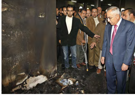
ראש הממשלה הפלסטיני סלאם פיאצ' מבקר במסגד שהוצת בכפר יאסוף (ופא, 13 בדצמבר)