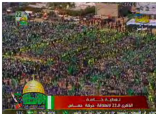
המונים בעצרת המרכזית לציון יום השנה להקמת חמאס בכיכר אלכתיבה אלח'צ'ראא' בעיר עזה (ערוץ אלאקצא, 14 בדצמבר, 2009)