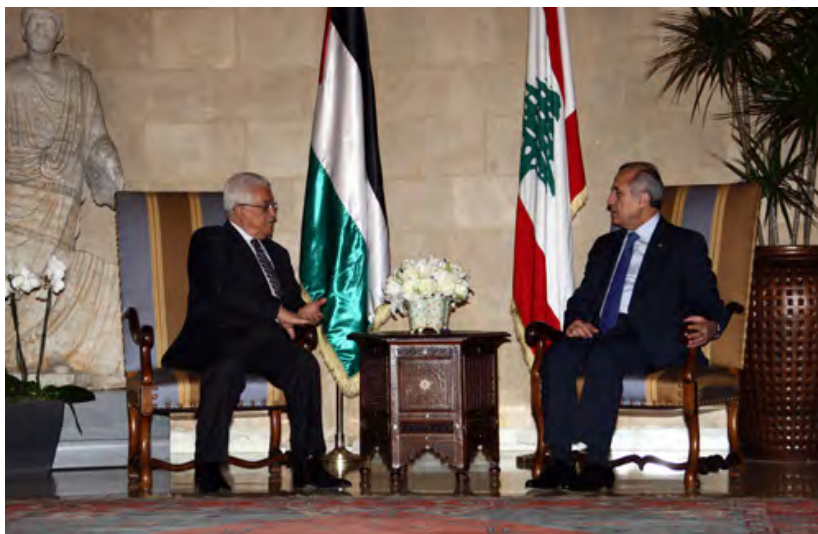
יו"ר הרשות הפלסטינית אבו מאזן נפגש עם נשיא לבנון מישל סלימאן ( ופא, 7 בדצמבר, 2009)