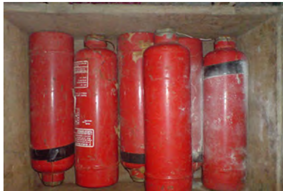
ששת מטעני החבלה שנמצאו בביתו של הפעיל בכפר סעיר (צילום: דובר צה"ל, 7 בדצמבר)