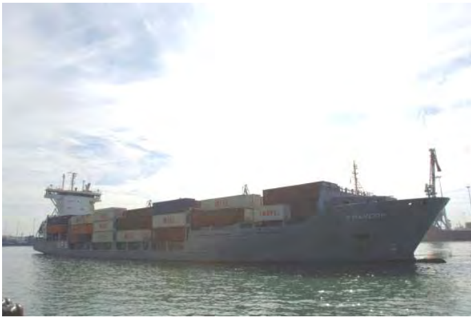
הספינה FRANCOP שנעצרה ע"י חיל הים ועליה אמצעי לחימה שמקורם באיראן