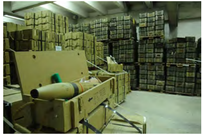
ארגזים ובהם אמצעי לחימה שנתפסו על גבי הספינה (דובר צה"ל, 5 בנובמבר, 2009)