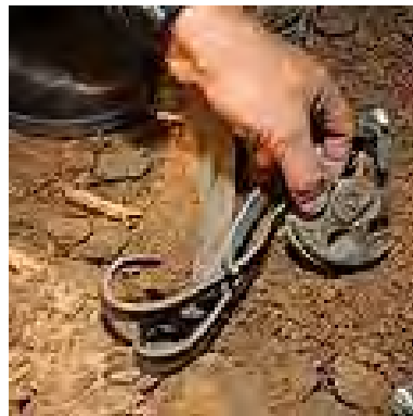
מימין: שרידי הרקטה שנורתה לעבר אצבע הגליל. משמאל: שריפה שנגרמה בעקבות הירי (27 באוקטובר 2009)