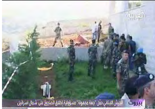
הסריקות בבית בחולא (אלערביה, 28 באוקטובר)