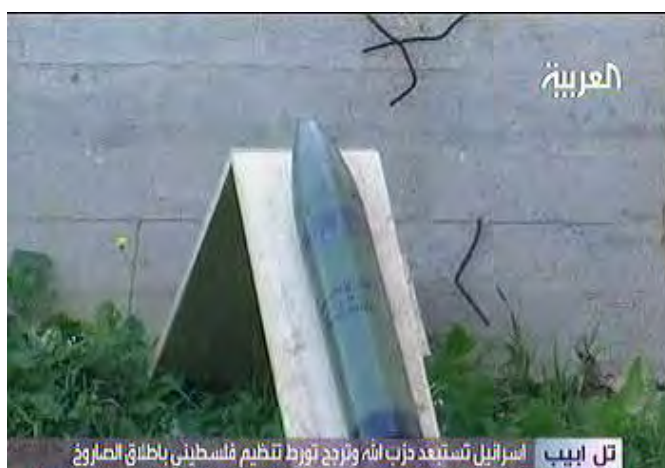
אחת מארבעת הרקטות הנוספות, שנמצאה בכפר חולא (אלערביה, 28 באוקטובר, 2009)