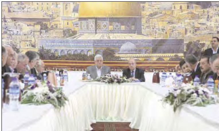
אבו מאזן במהלך הישיבה בה הודיע על קיום הבחירות ב-24 בינואר 2010 (אלחיאת אלג'דידה, 24 באוקטובר 2009).