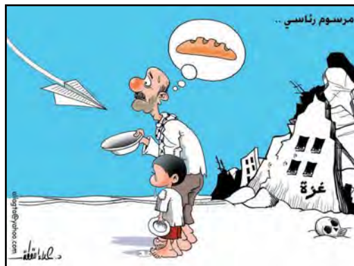
עזה הרוסה, התושבים מבקשים לחם ומקבלים במקומו צו נשיאותי מאבו מאזן ... ( עיתון פלסטין, 25 באוקטובר 2009 )

■ ברקע הוצאת הצו ע"י אבו מאזן עומדת הודעת חמאס (16 באוקטובר) על דחיית מסמך הפיוס המצרי, שהיה אמור להחתם בקהיר ב-26 באוקטובר. במישור המעשי , אין ביכולתה של הרשות הפלסטינית לקיים בחירות חופשיות ברצועת עזה לנוכח התנגדות חמאס ושליטתה על הרצועה. במישור הפוליטי ניתן לראות בהוצאת הצו מהלך שמטרתו להפעיל לחצים על חמאס תוך הצגתה כמי שמחבלת במאמצי הפיוס המצריים וחוששת מקיום הבחירות. מכל מקום, אבו מאזן הותיר פתח לשינוי המועד שנקבע בצו בהתאם להתקדמות מאמצי התיווך של מצרים.