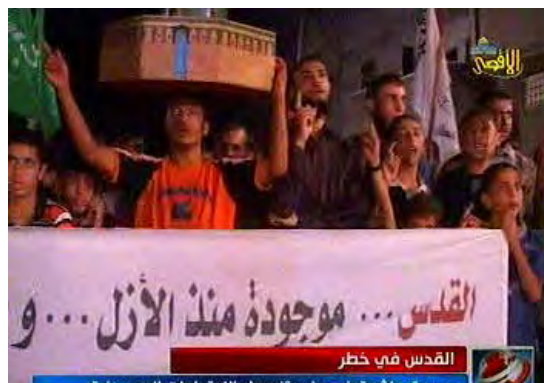
הפגנה שארגנה חמאס ברפיח ששודרה תחת הכותרת "ירושלים בסכנה" (ערוץ אלאקצא, 26 באוקטובר)