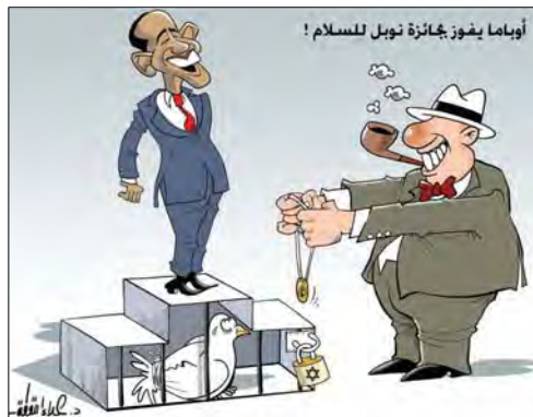
אובמה הזוכה בפרס נובל לשלום, כולא את יונת השלום (עיתון פלסטין של חמאס, 11 באוקטובר, 2009)

■ בנאום שנשא ח'אלד משעל בדמשק בלטו הנושאים הבאים (ערוץ אלאקצא, 11 באוקטובר): ● התקפה על ממשל אובמה: ממשל אובמה שבתחילת דרכו הציג "שפה אחרת", והראה סימנים חיוביים, לא תרגם את דבריו לשפת המעשה. לדברי ח'אלד משעל ברק אובמה קיבל פרס נובל רק על מילותיו היפות ועל הבטחותיו ללא כיסוי: "ממשל אובמה נותן לנו מילים ולאויבינו את מעשיו" לפיכך, טוען ח'אלד משעל, אין לפלסטינים גיבוי במאבקם נגד ישראל.