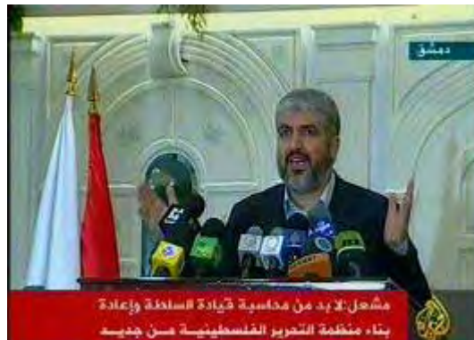
ח'אלד משעל נואם בדמשק