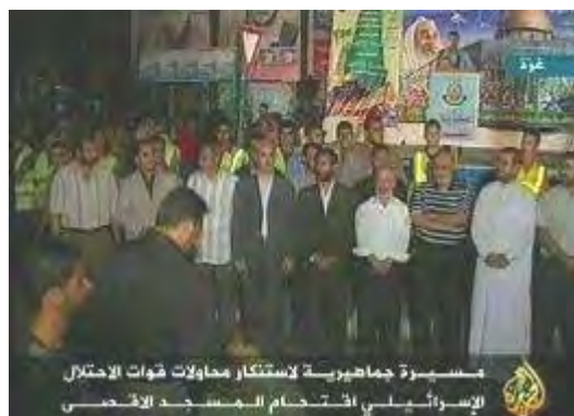
הפגנות מחאה ברצועת עזה על האירועים בירושלים מימין: הפגנה בהשתתפות בכירי חמאס (אלג'זירה, 27 בספטמבר) משמאל: הפגנת נשים (ערוץ אלאקצא, 28 בספטמבר)

■ להלן עיקרי התגובות של הרשות הפלסטינית: