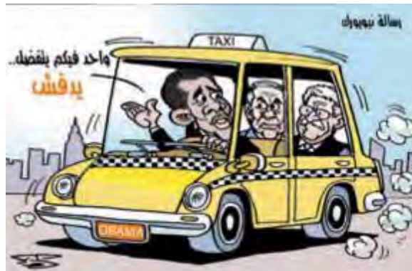
הנשיא אובמה לנתניהו ואבו מאזן: אחד מכם ירד לדחוף (אלאיום, 24 בספטמבר)

■ "בכירים פלסטיניים" אמרו כי במהלך שיחות הבילטרליות בין הצוות הפלסטיני לצוות האמריקני בשולי העצרת האו"ם ב-22 בספטמבר, הבחינו בנסיגה בעמדה האמריקנית בעניין הפעילות בהתנחלויות . לדבריהם השימוש שעשה נשיא ארצות הברית אובמה בפגישה המשולשת בביטוי "ריסון" הפעילות בהתנחלויות , לאחר שדיבר בעבר על "הפסקת" הפעילות בהתנחלויות, הינה ביטוי לנסיגה הזאת. "בכיר במשלחת הפלסטינית" מסר כי "יש נסיגה בעמדה האמריקנית כלפי נושא הפסקת הפעילות בהתנחלויות, שבה רואה אבו מאזן תנאי בסיסי לחידוש המו"מ, אולם אין לנו אינטרס להיקלע לעימות עם הממשל האמריקני כרגע" (סוכנות הידיעות האיטלקית AKI, 23 בספטמבר, 2009).