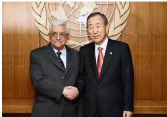
אבו מאזן נפגש עם מזכ"ל האו"ם (סוכנות ופא, 24 בספטמבר).

■ "מקורות פלסטיניים" מסרו כי שיחות אמריקניות-פלסטיניות ואמריקניות-ישראליות נפרדות יחלו בוואשינגטון בתחילת אוקטובר 2009. בראש המשלחת הפלסטינית יעמוד צא"ב עריקאת, ראש מחלקת המו"מ באש"ף, ויועצו של ראש ממשלת ישראל בנימין נתניהו יעמוד בראש המשלחת הישראלית (אלאיאם, 26 בספטמבר, 2009). צא"ב עריקאת , מסר בראיון לרדיו פלסטיני שהפלסטינים יחלו בפגישות עם האמריקנים ב-1 באוקטובר. הוא הביע תקווה ש"הממשל האמריקני יחייב את ממשלת ישראל להסכים לעצור את הבנייה בהתנחלויות כולל הריבוי הטבעי וירושלים, וכן לחדש את המו"מ על הסדר הקבע מהיכן שהופסק. אילו הם נושאי הדיון המרכזיים" (רדיו פלסטין, 26 באוקטובר, 2009).