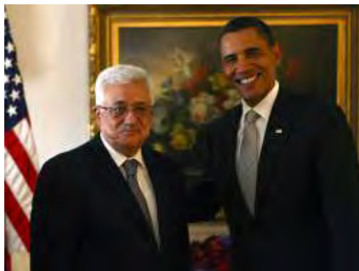
יו"ר הרשות הפלסטינית אבו מאזן בפגישתו עם נשיא ארה"ב אובמה (סוכנות ופא, 22 בספטמבר)

הדבר מצא ביטוי בנאומו נשיא ארצות הברית וראש ממשלת ישראל בעצרת האו"ם, אשר שמו את הדגש על הנושא האיראני. להלן עיקרי העמדות של ישראל, ארצות הברית והפלסטינים.