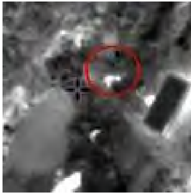
תקיפת החוליה ברצועת עזה (25 בספטמבר)