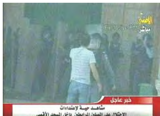
האירועים במסגד אלאקצא כפי שצולמו במצלמת חובבים ושודרו בשידור ישיר בערוץ אלאקצא של חמאס (25 בספטמבר)