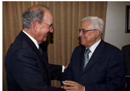
יו"ר הרשות הפלסטינית אבו מאזן עם השליח האמריקני למזרח התיכון ג'ורג' מיטשל (ופא, 16 בספטמבר, 2009)