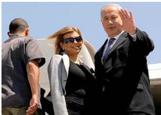
ראש הממשלה בנימין נתניהו בדרכו ללונדון לפגישה עם השליח האמריקני מיטשל

■ לקראת צאתו לבריטניה וגרמניה לשיחות מדיניות, ולפגישה עם המתאם האמריקני מיטשל, אמר ראש הממשלה בנימין נתניהו בישיבת הממשלה ב- 23 באוגוסט: "... יש רצון מצד האמריקנים ואחרים, וגם מבחינתנו, לחזור בחזרה לשיחות בינינו לבין הפלסטינים. כללית יש הערכה, שניתן לעשות זאת בסוף ספטמבר, אבל גם זה מותנה בהבנות בינינו לבין האמריקנים, כמובן יחד עם הפלסטינים, אבל זה, פחות או יותר, הכיוון והזמן שהיינו רוצים להשיג. יש עדיין תחומים של אי הסכמה, הם מוכרים ולא ברור עד כמה ובאיזו מידה מדינות ערב יהיו שותפות לתחילת השקת התהליך" (אתר משרד ראש הממשלה, 23 באוגוסט).