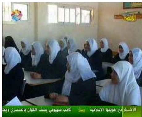
משלחת סיעת חמאס במועצה המחוקקת מבקרת בבתי ספר ברצועה עם פתיחת שנת הלימודים (ערוץ אלאקצא, 23 באוגוסט)