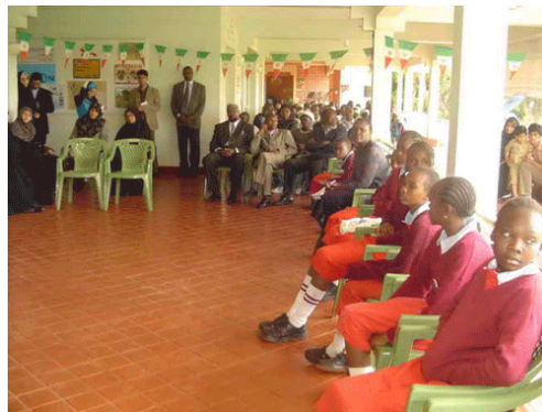
אירועי שבוע הידידות בין ילדי איראן וילדי קניה ( http://www.icro.ir )