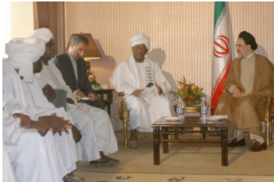
ביקור נשיא איראן ח'תאמי בסודאן (5 באוקטובר, 2004)

15. באוקטובר 2004 ביקר בסודאן נשיא איראן דאז ח'תאמי. במהלך 2009 איראן גינתה את צו המעצר הבינלאומי שהוצא נגד נשיא סודאן עמר אלבשיר על ידי בית הדין הבינלאומי לפשעים (ICC) והגדירה אותו "לא צודק ומונע משיקולים פוליטיים" (אירנ"א, 9 מרץ 2009) במקביל, הביעה הנהגת סודאן תמיכה בזכותה של איראן לאנרגיה גרעינית. זמן קצר לאחר שאיראן יצאה להגנתו של עמר אלבשיר יצא יו"ר המג'לס לריג'אני לביקור בסודאן (מרץ 2009), שהפתיע אפילו את חברי הועדה למדיניות חוץ ולביטחון לאומי במג'לס האיראני (אעתמאד-י מלי 30 מרץ). במהלך הביקור נפגש לריג'אני עם עמר אלבשיר נגדו הוצא צו המעצר.