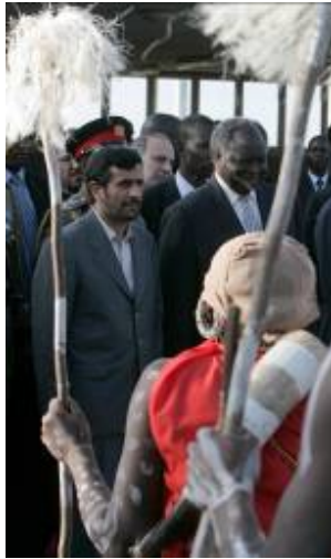
ביקור נשיא איראן אחמדינז'אד בקניה (רויטרס, 24 בפברואר, 2009. צילום: אנתוני נג'וגונה)

24. איראן וקניה הסכימו להקים קווי ספנות בין בנדר עבאס למומבסה ולבנות מרכז מסחרי איראני בניירובי . התקשורת הקנייתית דיווחה, בעקבות דבריו של נשיא קניה, כי יתכן ואיראן תסייע לקניה לבנות כור גרעיני להפקת חשמל. ג'שוע מוסימי, האחראי על פיתוח תשתיות אנרגיה במשרד התכנון של קניה, ציין, כי קניה מחפשת שותף שיספק לה ידע בתחום פיתוח אנרגיה גרעינית עבודה. בינתיים מעורבת איראן בפרויקטים שונים להפקת אנרגיה בקניה. ממשלת קניה כבר שכרה חברה איראנית לבנות כור הידרו-אלקטרי צפונית לבירה ניירובי ותחנת כוח המופעלת בגז בקרבת מומבסה. איראן תספק לקניה גם 4 מיליון טון של נפט גולמי (כ-80,000 חביות ליום). בכיר במשרד החוץ של קניה אמר כי "איראן מעוניינת בהגעת חברות איראניות לקניה לסלילת כבישים, בניית סכרים ופיתוח תעשיית התרופות". במשלחת האיראנית, שנלוותה לאחמדינז'אד, נכללו גם אנשי עסקים מהסקטור הפרטי. איראן מייצאת נפט, כימיקלים ושטחים לקניה וקניה מייצאת תה לאיראן ומעוניינת לייצא גם בשר ודגים. על פי הסכמים שנחתמו במהלך ביקורו של אחמדינז'אד במדינה (פארס ניוז, 6 מרץ, 2009) איראן העניקה לקניה הלוואה על סך 10 מיליון דולר.