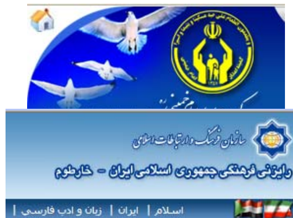
אתר האינטרנט של מרכז התרבות האיראני הפועל בח'רטום

18. במסגרת פעילותה החתרנית שלחה איראן אמצעי לחימה רבים לסודאן. חלקם סופקו לרצועת עזה (בעיקר עבור חמאס), חלקם עבור ארגונים האסלאמיים רדיקאליים ממדינות צפון אפריקה וחלקם שמש להדרכה ולאימונים על אדמת סודאן. בח'רטום פועלת שלוחה של מרכז התרבות האיראנית , המשמש מקום מפגש לגורמים אסלאמיים ומרכז להפצת חומר תעמולה איראני וספרות שיעית (שיטת פעולה דומה של קידום השפעה פוליטית באמצעות פעילות תרבותית ודתית נוקטת איראן גם במדינות אמריקה הלטינית). סודאן מצידה נותנת יד חופשית לאיראן לנהל משטחה את פעילותה החתרנית.