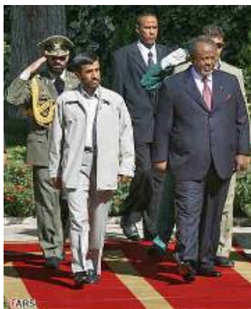
ביקור נשיא ג'יבוטי באיראן (פארס, 5 בספטמבר, 2006)

39. בעת סבב הביקורים שערך במדינות אפריקה (פברואר 2009) הייתה ג'יבוטי המדינה הראשונה בה ביקר. המשלחת האיראנית שנלוותה לאחמדינז'אד הציעה לסייע לג'יבוטי בתחום המדע, התעשייה וההנדסה כדי לקדם מיזמים שונים במדינה. איראן גם העניקה הלוואה לג'יבוטי וסייעה להקים מרכז להדרכה מקצועית במדינה.