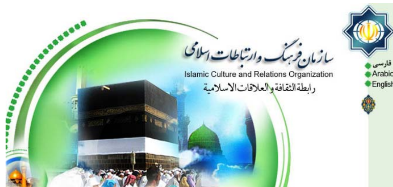
אתר האינטרנט של מרכז התרבות האיראני בקניה

28. לאיראן משרד תרבות גדול בקניה , הפועל לצד השגרירות שלה במקום והוא אחראי על הפעילות התרבותית-דתית, כמו גם על עדכון שוטף על הנעשה באיראן. הנציגות בקניה מהווה שלוחה של ICRO Islamic Culture and Relations Organization ולה שלוחות במדינות נוספות באפריקה. בסוף יוני 2009 ארגן המשרד את שבוע הידידות איראן – קניה. במהלך חודש יולי צוין שבוע הידידות בין ילדי איראן וקניה ביוזמת מרכז התרבות האיראני. ובמסגרת זו הועברו לניירובי 211 ספרים וכן סרטים, תוכנות וציורי ילדים. באתר מפורסמות הזמנות לתחרויות שונות באיראן בנושא שינון הקוראן ופעילות תרבותית אחרת שתכליתה לקרב את האסלאם בקניה לאסכולה השיעית באסלאם.