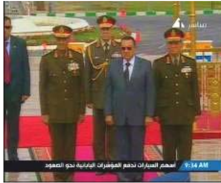
נשיא מצרים בעת נאומו בטקס יום השנה ה-27 לשחרור סיני: "...לא נאפשר התערבות של גורמים אזוריים המתנגדים לשלום ודוחפים את האזור על פי תהום..." (המקור: טלוויזיה מצרית, 23 באפריל)