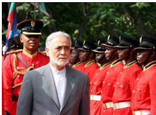
סגן נשיא איראן מתקבל על ידי משמר כבוד עם הגיעו לביקור בטנזניה (רויטרס, 11 במאי 2009)

42. במאי 2009 ביקר בטנזניה פרויס דאודי, סגן נשיא איראן, שנועד עם נשיא טנזניה ודן עימו בהרחבת הקשרים בין שתי המדינות. במהלך ביקורו נחתם הסכם סחר, חקלאות ויחסים בילטראליים בין שתי המדינות. דאודי אמר ששתי המדינות כבר השיגו הישגים מרשימים בהרחבת היחסים ביניהן בעיקר בתחום הכלכלי. (אירנה, 12 במאי, 2009).