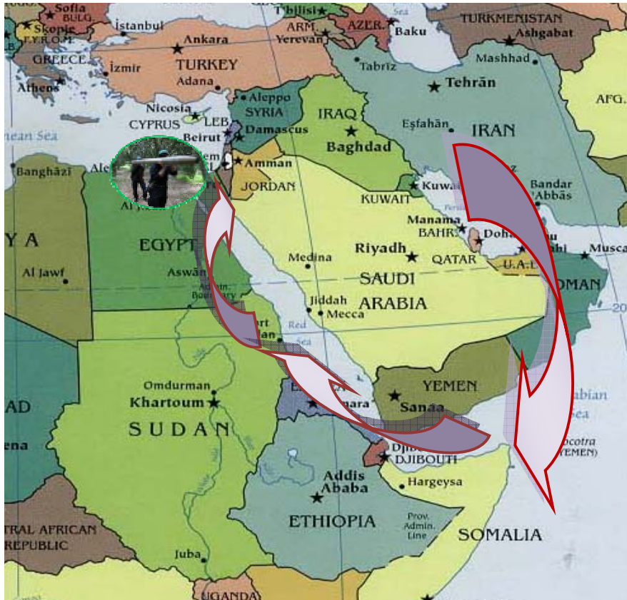
נתיב הברחת אמצעי הלחימה מאיראן לרצועת עזה

ב. חשיפת התארגנות חזבאללה במצרים, שעסקה בהברחת אמצעי לחימה לרצועת עזה, בעידוד פעילות טרור נגד ישראל ובחתרנות נגד המשטר המצרי. בסוף 2008 חשפו שירותי הביטחון המצרים התארגנות של חזבאללה, שפעלה על אדמת מצרים. בשלב הראשון, הוצנעה הפרשה ולא זכתה לסיקור תקשורתי. בתחילת אפריל 2009 החליט המשטר המצרי לתת פומבי למעצרים, לחקירות אנשי ההתארגנות ולמשמעויות החמורות בראייתו העולות מפעילות חזבאללה בשליחותה של איראן על אדמת מצרים. התארגנות זאת נתפסת ומוצגת ע"י המשטר המצרי כ"מזימה" איראנית לערער את יציבותה של מצרים ולקדם את יעדיה האסטרטגים של איראן במסגרת חתירתה להגמוניה אזורית. חסן נצראללה, מנהיג חזבאללה, הנתפס ע"י המצרים כמכשיר לקידום יעדי המשטר האיראני, זכה ל"טיפול" מיוחד של התקשורת המצרית שכינתה אותו, בין השאר, "שיח' קוף", "סוכן איראני" ו"מנהיג מליציות במפלגה האיראנית בלבנון". אצבע מאשימה הופנתה גם כלפי האחים המוסלמים במצרים, שהוצגו כמי שהיו קשורים להתארגנות ותמכו בה. 6 בסוף יולי הגישה מצרים כתבי אישום נגד 26 עצורים בהתארגנות חזבאללה המואשמים בחברות בארגון טרור שפעל לבצע פיגועי טרור וסיפק אמצעי לחימה לחמאס ברצועת עזה.