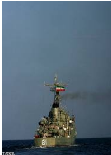
ספינת חיל הים האיראני

34. על רקע איום הפיראטים, שלח שגריר איראן באו"ם מכתב למזכ"ל באן קי מון לפיו תשלח איראן שתי ספינות של חיל הים האיראני לחופי סומליה ומפרץ עדן לתקופה של כחמישה חודשים. זאת, על מנת להלחם בתופעת הפיראטיות באזור ולהגן על ספינות איראניות המובילות סחורות 8 (אירנ"א, 14 במאי 2009). נוכחות של ספינות חיל הים האיראני באזור סומליה תאפשר לאיראן לא רק להגן על ספינותיה אלא גם להשיג חופש פעולה נרחב יותר באזור.