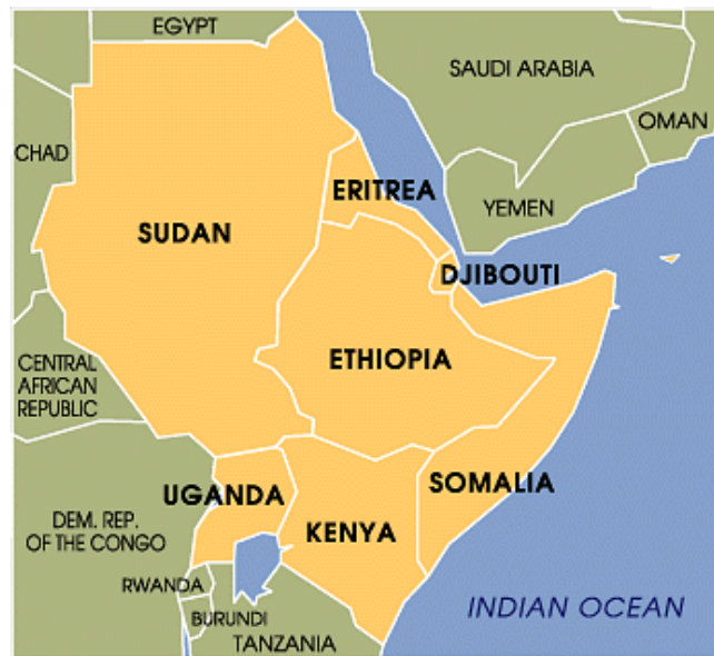
מדינות קרן אפריקה ומבואות ים-סוף