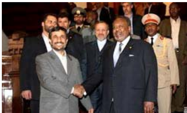
נשיא איראן אחמדינז'אד בביקורו בג'יבוטי (24 בפברואר, 2009)

39. בעת סבב הביקורים שערך במדינות אפריקה (פברואר 2009) הייתה ג'יבוטי המדינה הראשונה בה ביקר. המשלחת האיראנית שנלוותה לאחמדינז'אד הציעה לסייע לג'יבוטי בתחום המדע, התעשייה וההנדסה כדי לקדם מיזמים שונים במדינה. איראן גם העניקה הלוואה לג'יבוטי וסייעה להקים מרכז להדרכה מקצועית במדינה.