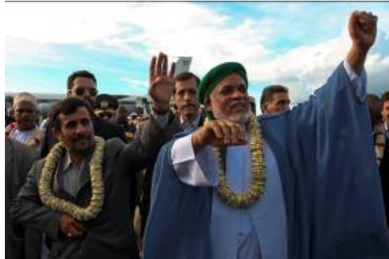
ביקור אחמדינז'אד באיי קומורו

37. תחנתו הראשונה של אחמדינז'אד בביקורו השנה באפריקה הייתה איי קומורו. שם חתם על מזכרי הבנה "להרחבת הקשרים הפוליטיים וסייע לקידום פרויקטים בתחום הפיתוח וההכשרה באיים. נשיא איראן נפגש עם בכירים במקום והבטיח סיוע איראני לקידום פרויקטים שונים במקום. לאחר הביקור באיי קומורו הגיע אחמדינז'אד לביקור ראשון מסוגו של נשיא איראני בג'יבוטי (ראו להלן).