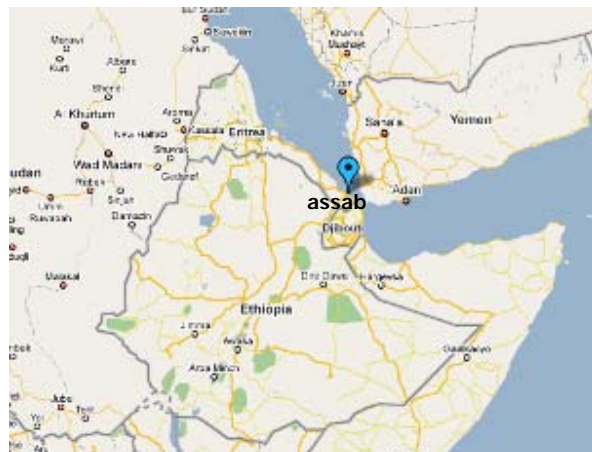
נמל assab באריתריאה

32. בחודשים האחרונים עלו יחסי איראן – אריתריאה לכתרות בעקבות דיווחים, לא מאומתים, בעיקר ממקורות אופוזיציה אריתראים, על הגעת ספינות קרב וצוללות איראניות לעיר הנמל Assab הממוקמת במיקום אסטרטגי במבואות ים-סוף. על פי אותם מקורות איראן הציבה במקום חיילים וטילים ארוכי טווח כדי להגן על מתקן זיקוק נפט. דיווחים אלה הוכחשו על ידי הנהגת אריתריאה.