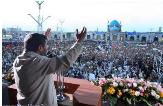
"עת האמאם מהדי... ייעוד מהפכני גלובלי" ( אתר נשיא איראן, 18 יולי)

באמצעות מעורבות חזקה בעניינים בינלאומיים". 3