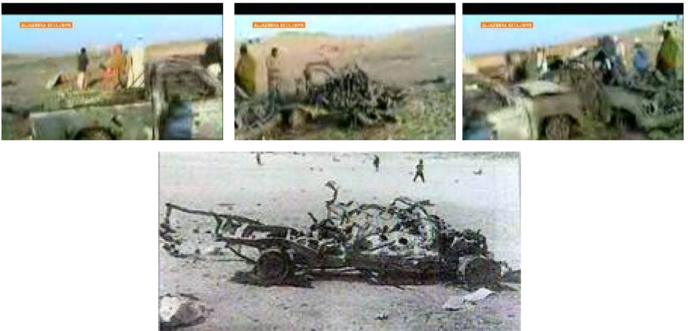
תמונות שעל פי ערוץ אלג'זירה צולמו באתר התקיפה בסודאן (אלג'זירה, 26 במרץ, 2009)

ינואר 2009 ישראל תקפה בסודאן שיירה של אמצעי לחימה שהיתה בדרכה לרצועת עזה. על פי הדיווחים מטוסים ישראלים תקפו בסודאן שיירה שמנתה כעשרים משאיות עמוסות אמצעי לחימה, שהיו בדרכן לרצועת עזה. על פי הדיווח התקיפה הייתה באזור מדברי, דרומית-מערבית לעיר הנמל הסעודית פורט-סודאן, ונהרגו בה 39 בני אדם (רשת CBS, 25 במרץ). על פי דיווחים נוספים משלוח אמצעי הלחימה שהותקף, יצא מאיראן , מומן ע"י קרן האמאם ח'מיני. המשלוח כלל טילי פאג'ר 3 ארוכי טווח, שטווח הפגיעה שלהם מגיע לתל אביב (טיים 29 במרץ) 5 .