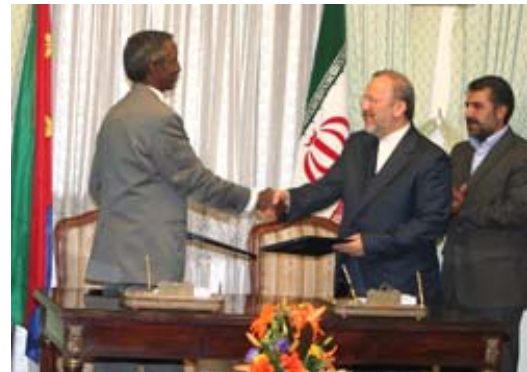
חתימה על הסכמים כלכליים דו-צדדיים בין איראן לאריתריאה (אתר משרד החוץ של אריתריאה, מאי 2008)

30. בעת ביקור נשיא אריתריאה באיראן שהו בה גם יו"ר הפרלמנט הסנגלי ושר החוץ של גאנה. על רקע זה העיתון השמרני סיאסטי-רוז סכם במאמר פרשנות קצר את האינטרסים המרכזיים של איראן בקשריה עם מדינות אפריקה. לשיטתו, ביקוריהם של הבכירים האפריקאים באיראן מצביעים על החשיבות הרבה שמקנה איראן לפיתוח יחסיה עם יבשת אפריקה. העיתון מציין כי חשוב שאיראן תפתח את היחסים עם אפריקה שכן יש בה הרבה מדינות מוסלמיות מהן מתעלמות המעצמות ובהן טמון פוטנציאל כלכלי רב העיתון ציין כי בנוסף לכך הארגון לאחדות אפריקה על המדינות הרבות החברות בו, יכול להיות בעל-ברית מועיל עבור איראן בזירה הבינלאומית.