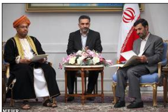
נשיא איראן אחמדינ'אד נועד עם שגריר איי קומורו בטהראן (מאברה, 11 ביוני, 2008)

36. ביוני 2008 נפגש נשיא איראן אחמדינ'אד עם אחמד נג'אן אלמרוזקי, השגריר החדש של איי קומורו באיראן. הייתה זו הזדמנות עבור נשיא איראן לקרוא להרחבה והעמקה של הקרים בין שתי המדינות (טהראן טיימס, 11 ביוני, 2008).