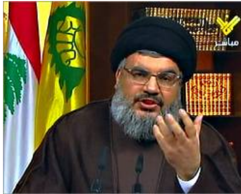
חסן נצאללה בנאומו בו הודה כי פעיל חזבאללה עסק בהברחת אמצעי לחימה ו"לוחמים" למצרים (אלמנאר, 11 באפריל 2009)

20. התקשורת המצרית, הממסדית והלא ממסדית, ובכירים מצריים, ובראשם הנשיא חסני מברכ , ניצלו את חשיפת התארגנות חזבאללה על מנת לתקוף בשצף קצף את איראן , בהאשימם אותה באחריות ל"קנוניה" נגד מצרים ובניצול הנושא הפלסטיני לשם קידום האינטרסים האזוריים שלה . במקביל ניסה המשטר המצרי לקצור פירות גם בזירה הפנימית ע"י האשמת האחים המוסלמים בזיקה להתארגנות חזבאללה. ה"מתקפה התקשורתית" של מצרים נגד איראן סימנה שלב חדש בעימות שבין מצרים (ומדינות פרו-מערביות נוספות) לבין איראן, המפעילה ארגוני טרור כמו חזבאללה וחמאס, ומשתמשת בסודאן כבסיס לעידוד טרור וחתרנות.