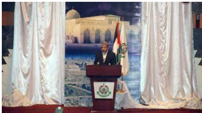
ח'אלד משעל נושא את נאומו

■ ב- 26 ביוני נשא ח'אלד משעל, יו"ר הלשכה המדינית של חמאס, נאום בו הציג את עמדות החמאס כלפי מספר סוגיות מדינות העומדות על הפרק. אמנם, הנאום לא היה מתלהם אבל מאידך לא ניכרה בו "מתקפת החיוכים" כלפי ארה"ב, שבה נקט חמאס בתקופה האחרונה.