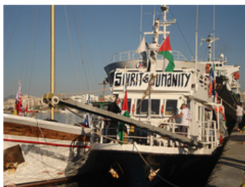
מימין" הספינה Sprit of Humanity. משמאל: הספינה עוזבת את נמל לרנקה (Free Gaza, 29 ביוני)

■ הסניף האמריקאי של ארגון Viva Palestine פתח באתר האינטרנט שלו הרשמה להצטרפות לשיירת סיוע הומניטארי של הארגון, שתצא מניו יורק בתחילת יולי ותכנס לרצועת עזה דרך מצרים. במקביל תצא שיירה דומה של סיוע מבריטניה (אתר Viva Palestine, 24 ביוני).