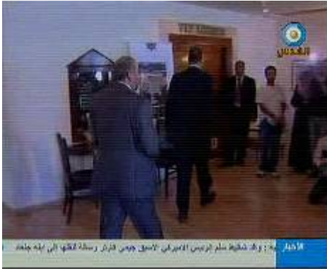
משתתפי ועדת הפיוס בראמאללה נכנסים לשיבה.