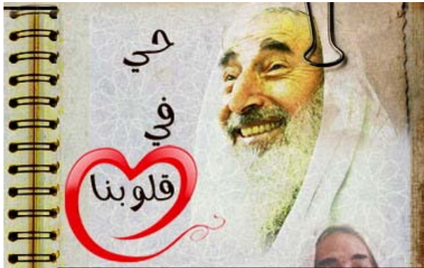
תמונת מקים חמאס, שיח' אחמד יאסין והכתובת "חי בליבנו"