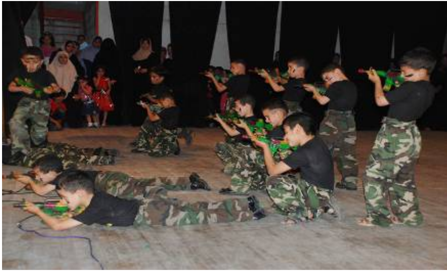
ירי לעבר חיילי צה"ל