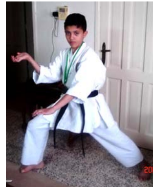
מתוך כתבה על ילד מעזה בעל חגורה שחורה בקראטה, שנפצע ברגלו, לדברי הכותב, מאש צה"ל במהלך מבצע "עופרת יצוקה". הילד מצוטט כאומר כי אם יתחרה בחו"ל נגד יריב ישראלי הוא "יגרום לו להיכנע או יהרוג אותו ממכות".