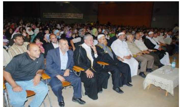
בני משפחה גאים נוכחים במיצג של ילדי הגן. משמאל: ילד עטוי סרט של פלוגות ירושלים, הזרוע הצבאית-טרוריסטית של הג'האד האסלאמי בפלסטין