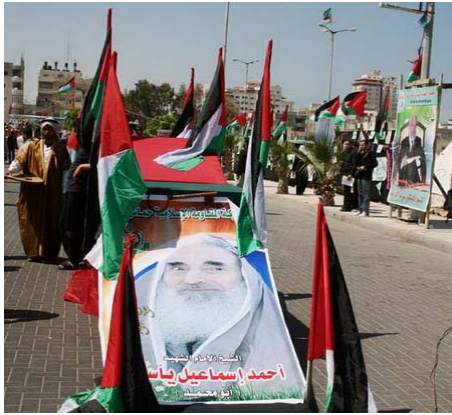
תמונה מתוך פעילות לאזכור 61 שנה לנכבה (השואה הפלסטינית, קרי: הקמת מדינת ישראל בראייה הפלסטינית). במרכז: פוסטר של אחמד יאסין, מייסד חמאס.