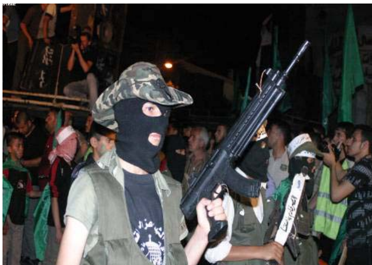
נערים רעולי פנים נושאי נשק בתהלוכת מחאה של חמאס בעזה בעקבות התקרית בקלקיליה (4 יוני, 2009) במהלכה הרגו מנגנוני הביטחון של הרשות הפלסטינית שלושה פעילי חמאס

12. תנועת חמאס מרבה לשתף ילדים ובני נוער (לעיתים באופן פעיל) בפעילות התעמולתית הנמרצת המתבצעת על ידה ברצועת עזה בקרב האוכלוסייה. זאת על מנת להחדיר לקרבם את ערכי האידיאולוגיה והמסרים של החמאס מגיל צעיר ולהמחיש בפני הציבור הפלסטיני את תמיכת הדור הצעיר בתנועת החמאס ובערכיה. להלן דוגמאות עדכניות.