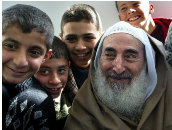
שיח' יאסין בלויית ילדים פלסטינים מחייכים. בכתבה מתואר יאסין כדמות מופת, מקים ומנהיג תנועת חמאס, שנהרג ע"י "רוצחי הנביאים", "היהודים הציונים הפחדנים".