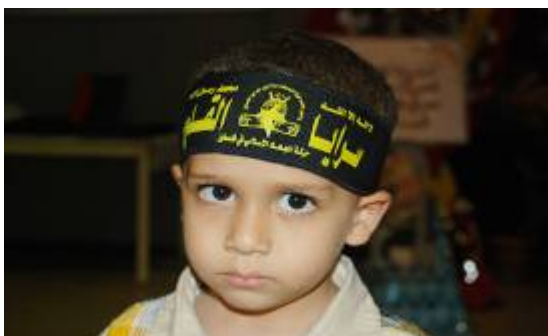
ילד עונד סרט של פלוגות ירושלים, הזרוע הצבאית-טרוריסטית של הג'האד האסלאמי בפלסטין