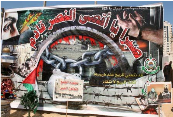
תמונה מתוך "תמונות ילדי פלסטין", כרזה של חמאס בה נכתב "סבלנות, הו אלאקצא, הניצחון קרב".