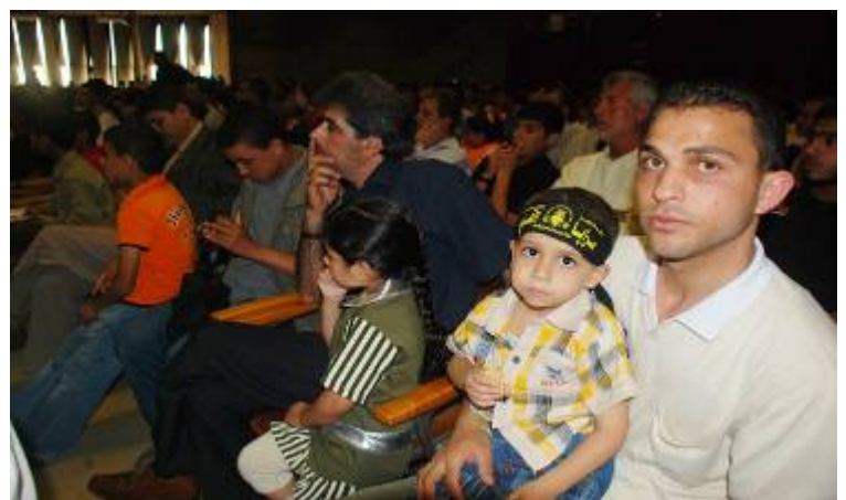
ילד יושב על ברכי אביו עטור סרט של פלוגות ירושלים, הזרוע הצבאית-טרוריסטית של הג'האד האסלאמי בפלסטין