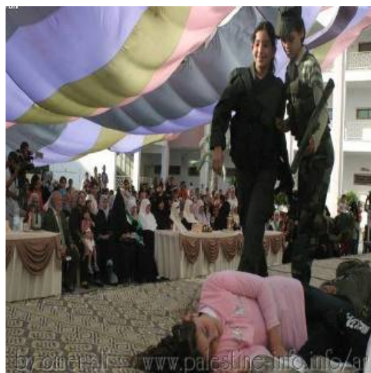
ילדות משתתפות במיצג במהלך אירוע מחאה של נשות חמאס בעזה (מימין) בעקבות התקרית בקלקיליה. משמאל: נשים נושאות תינוקות עם סמלי חמאס (אתר חמאס, 6 יוני)