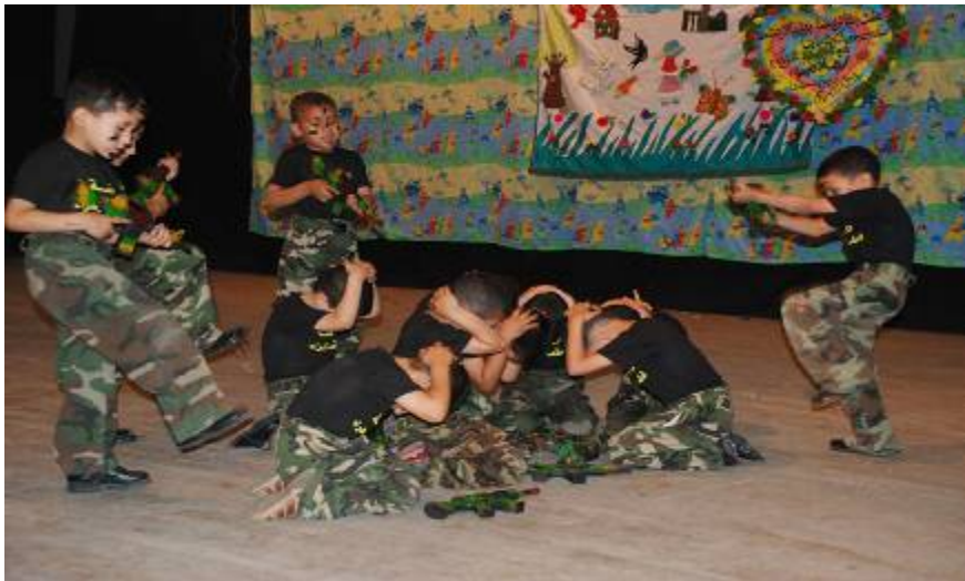
לקיחה בשבי של חיילי צה"ל (?)