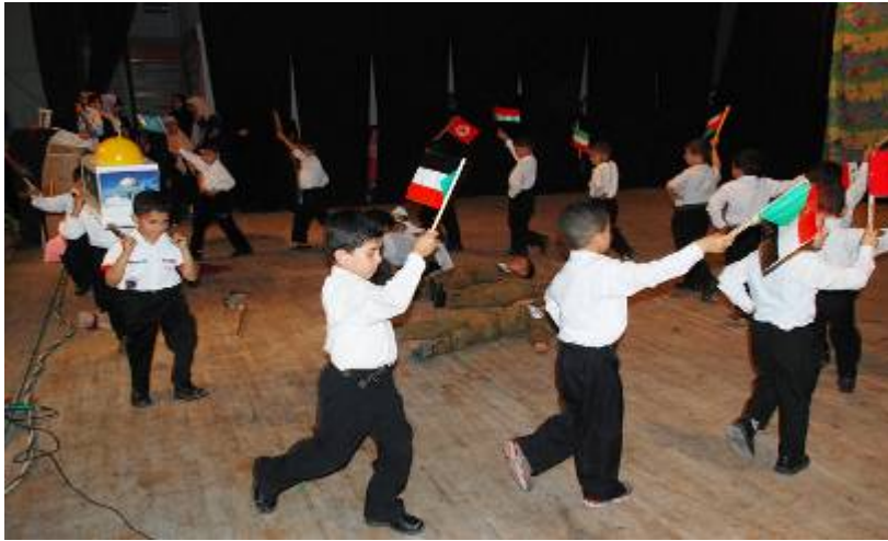
"ריקוד הניצחון" של ילדי הגן סביב גופות חיילי צה"ל השרועות על הרצפה, במרכז התמונה (על בגדיהם דגלי ישראל מוקטנים). ילדי הגן נושאים דגלי פלסטין ודגם של כיפת הסלע (סמל לשחרור ירושלים)