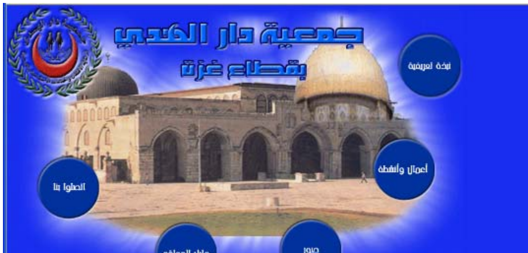
עמוד הבית של אתר האינטרנט של אגודת דאר אלהדא 3

10. בראש האגודה עומד מחמד עבד אלג'ואד פורה , מטיף המשמש כאחד ממנהיגי הג'האד האסלאמי בפלסטין ברצועת עזה. אתר המזוהה עם הג'האד האסלאמי (פאל טודיו), פרסם ב-3 ביוני 2009 תמונות מטקס סיום שנה של ילדים שסיימו את לימודיהם באגודת דאר אלהדא (ככל הנראה מדובר בילדי גן, שכן זו זירת הפעילות המרכזית של האגודה). הטקס נערך במרכז רשאד אלשוא בעזה . בטקס זה (שדומים לו נערכו בשנים קודמות בגני ילדים הקשורים לחמאס) הועלה מיצג בו מופיעים ילדי הגן לבושי מדים ונושאי נשק (מן הסתם רובי פלסטין) במהלכו הם מתעמתים עם חיילי צה"ל והורגים אותם.