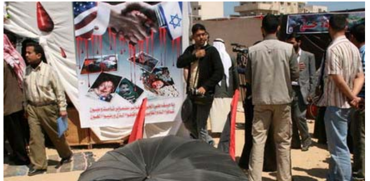
תמונה מתוך פעילות לאזכור 61 שנה לנכבה. בתמונה פוסטר בו נראים ילדים פלסטינים הרוגים ומעליהם לחיבת יד ישראלית-אמריקאית נוטפת דם.