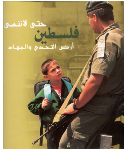
פוסטר של נער פלסטיני מתעמת עם חייל צה"ל ובו נכתב: "כדי שלא נשכח פלסטין, אדמה של אתגר וג'האד"