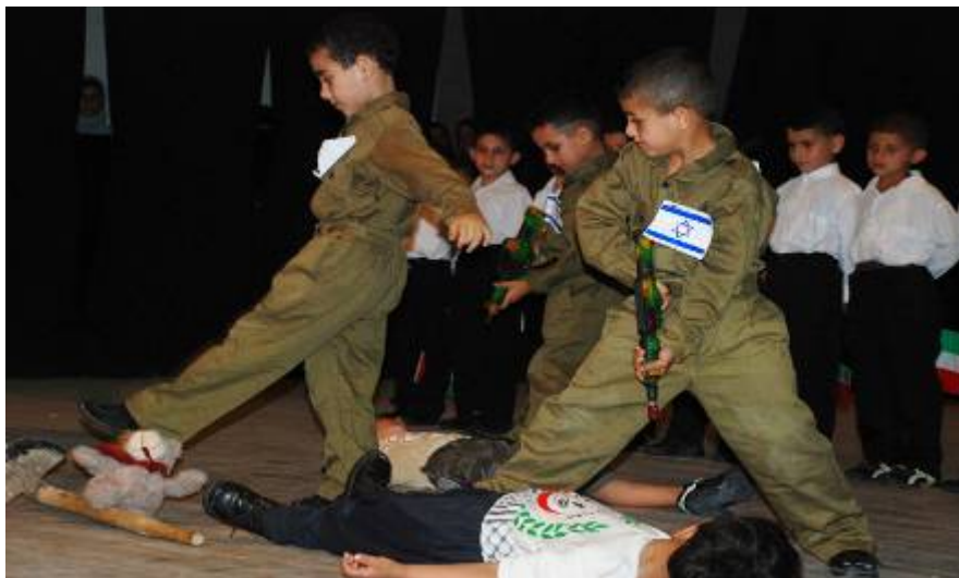
חיילי צה"ל (עם דגלי ישראל מוקטנים עליהם) הורגים ילדים פלסטינים