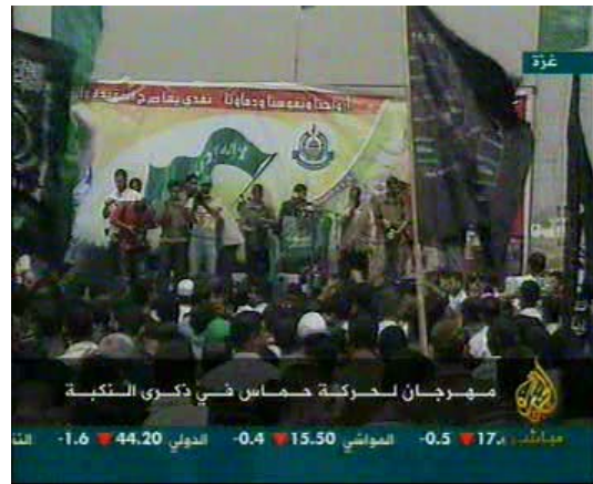
עצרת חמאס בעזה לציון "יום הנכבה" (אלג'זירה, 15 במאי)