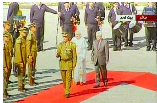
האפיפיור ויו"ר הרשות הפלסטינית אבו מאזן (הטלוויזיה הפלסטינית, 13 במאי)