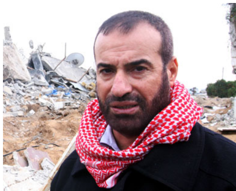
פתחי חמאד, שר הפנים החדש של ממשל חמאס

■ בראיון לרגל כניסתו לתפקיד של שר הפנים החדש של חמאס, פתחי חמאד, פירט חמאד את "הישגיו" של קודמו בתפקיד, סעיד ציאם (אשר נהרג במבצע "עופרת יצוקה"): "בין הישגיו הגדולים ביותר של השר היו יצירת קשר של שיתוף פעולה ותיאום בין מנגנוני הביטחון הנוכחיים ובין ההתנגדות הפלסטינית ... התהווה שיתוף פעולה נגד האויב הציוני... ועל כן הוא הפציץ את מטות מנגנוני הביטחון" (אתר משטרת חמאס, 7 במאי). דבריו אלו של פתחי חמאד ממחישים פעם נוספת את הקשר ההדוק הקיים בין מנגנוני הביטחון של ממשל חמאס לבין הזרוע הצבאית-טרוריסטית של התנועה (גדודי עז אלדין אלקסאם).