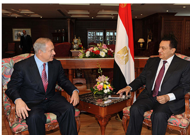
ראש הממשלה בנימין נתניהו ונשיא מצרים חסני מבראכ (11 במאי)